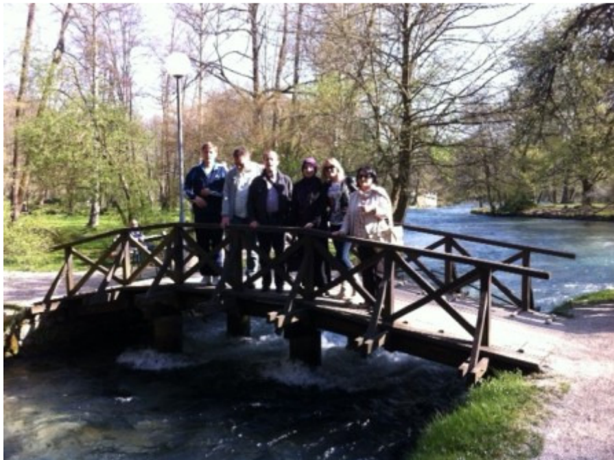
Na vrelo Bosne

Sutradan, u subotu svi smo ustali odmorni i zadovoljni. Prije nego što smo se uputili prema Mostaru posjetili smo vrelo Bosne gdje su nas čist zrak i voda oduševili.