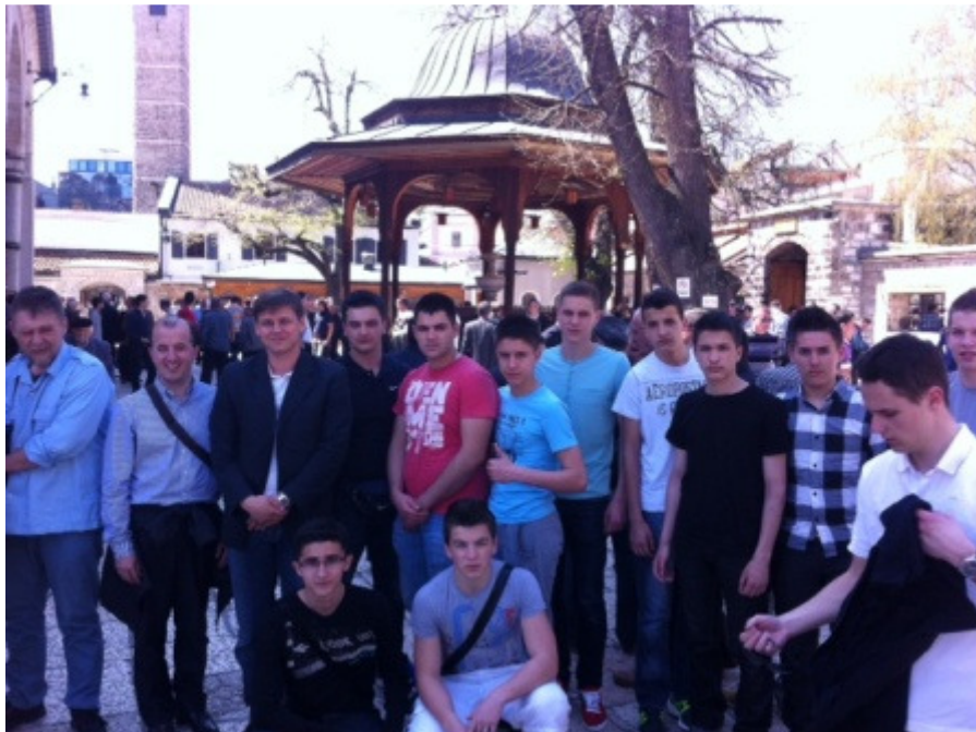
Ravnatelj, tajnik i učenici ispred Gazi Husrev-begove džamije

Putovanje smo započeli s parkirališta ispred Islamskog centra u Zagrebu u 5 sati ujutro, nakon što smo klanjali sabah - namaz. Svi smo bili vrlo sretni i uzbuđeni. Vožnja autobusom nama učenicima je uvijek zanimljiva tako da nismo ni primijetili, a već smo bili u Sarajevu. Cilj nam je bio da stignemo na džumu - namaz. I stigli smo točno kako smo planirali. Muškarci su klanjali džumu namaz u Gazi Husrev-begovoj džamiji.