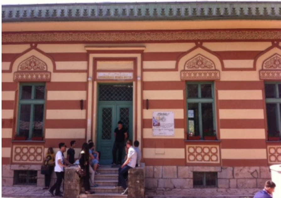
Karadžoz - begova medresa u Mostaru

Nakon razgledavanja vrela Bosne, krenuli smo prema Mostaru gdje su nas dočekali naši domaćini, učenice i učenici Karadžoz-begove medrese. Upoznali smo se s njima i svi zajedno krenuli u obilazak Mostara koji nas je oduševio.