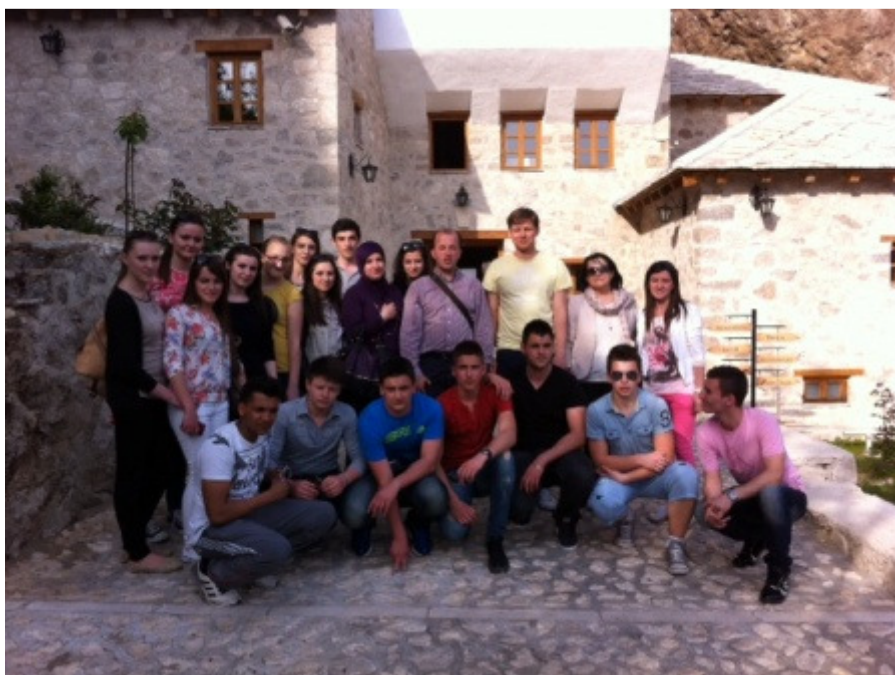
Tekija u Blagaju