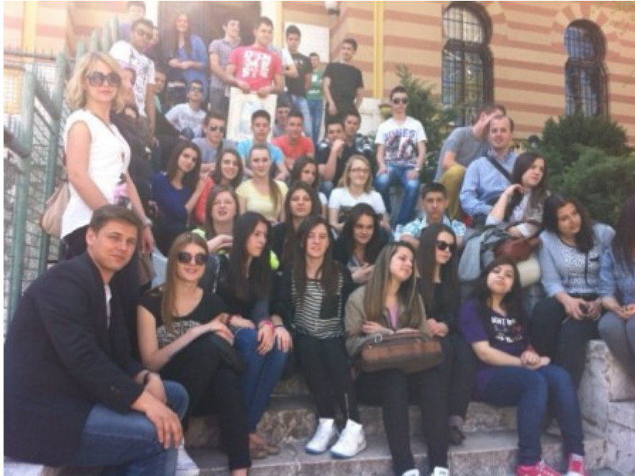
Zajednička fotografija ispred Fakulteta islamskih nauka