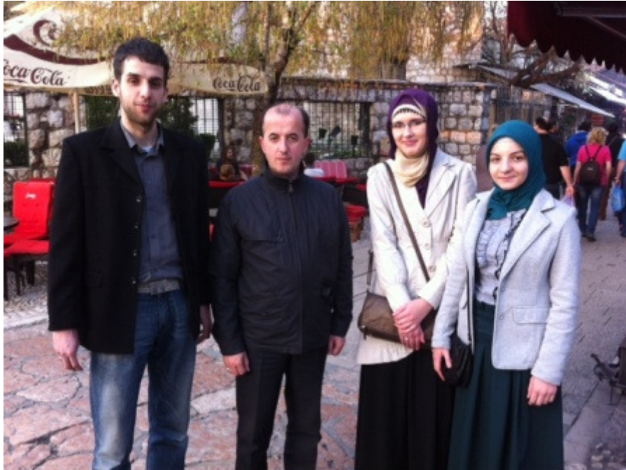
Ravnatelj u društvu svršenika naše škole, a danas vrijednih studenata

Bilo je učenika koji su po prvi puta posjetili Sarajevo, te su bili oduševljeni viđenim. Nakon razgledavanja grada polako smo krenuli prema hotelu Terme koji se nalazi na Ilidži tako da nismo dugo putovali. Udobno smo se smjestili i odmorili, te smo se uputili na večeru.