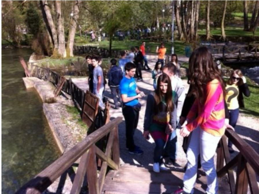
Učenice i učenici na vrelu Bosne ☺

Nakon razgledavanja vrela Bosne, krenuli smo prema Mostaru gdje su nas dočekali naši domaćini, učenice i učenici Karadžoz-begove medrese. Upoznali smo se s njima i svi zajedno krenuli u obilazak Mostara koji nas je oduševio.