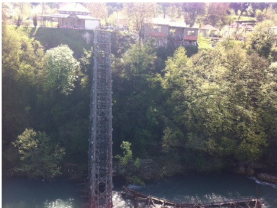
Poznati srušeni most prilikom bitke za Neretvu, Jablanica

Usput smo stali i u Jablanici kako bi vidjeli mjesto poznate bitke na Neretvi.