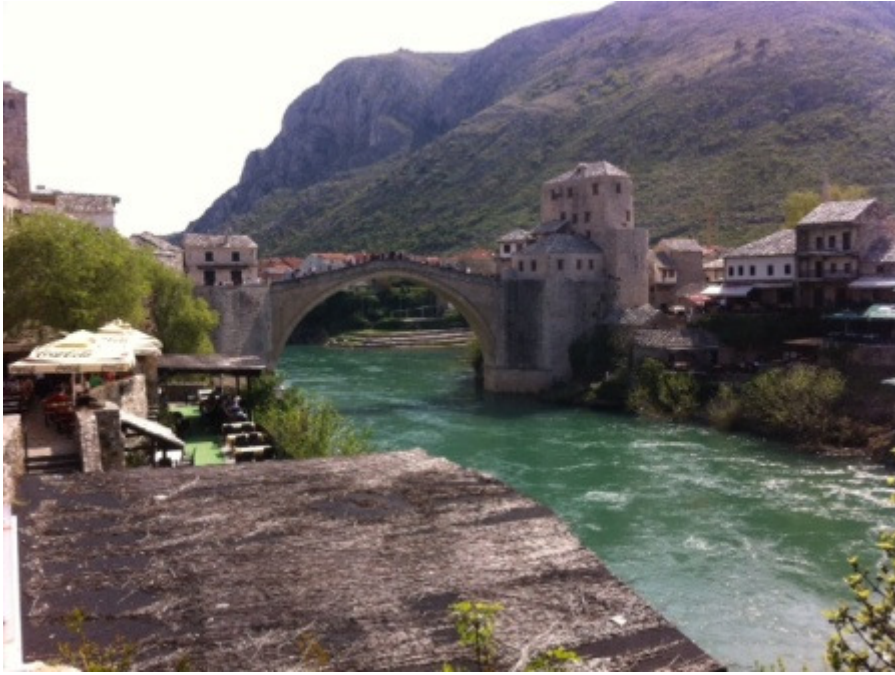
Stari most u Mostaru