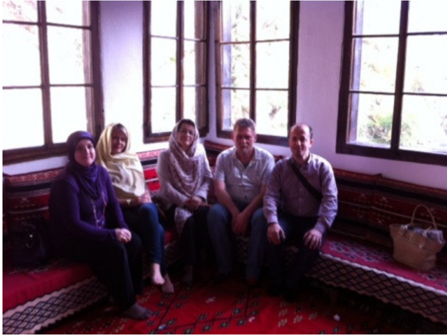
Ravnatelj i profesori u tekiji

Nakon što su nas tekija u Blagaju i Počitelj očarali, teškog srca smo se oprostili od naših novih prijatelja. Putem prema Zagrebu, zastali smo u restoranu Orahovica gdje smo svi zajedno večerali. Putovali smo cijelu noć, te smo u nedjelju ujutro u 6 sati stigli kući. S osmijehom na licu svi zadovoljni vratili smo se u Zagreb.