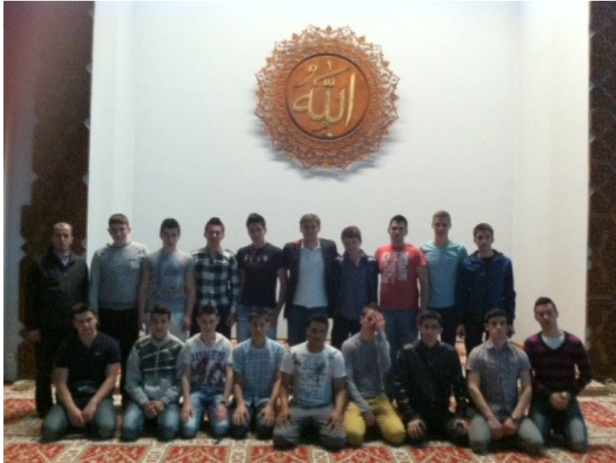
Ravnatelj, tajnik i učenici u Istiklal džamiji