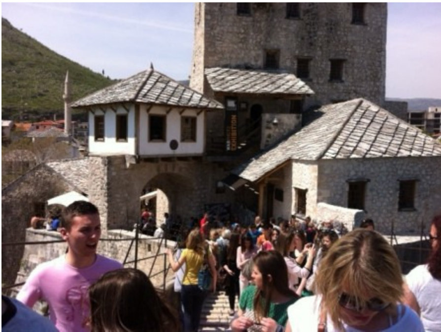
Na sredini Starog mosta u Mostaru

Teškog srca oprostili smo se od Mostara te smo krenuli prema tekiji u Blagaju i Počitelju.