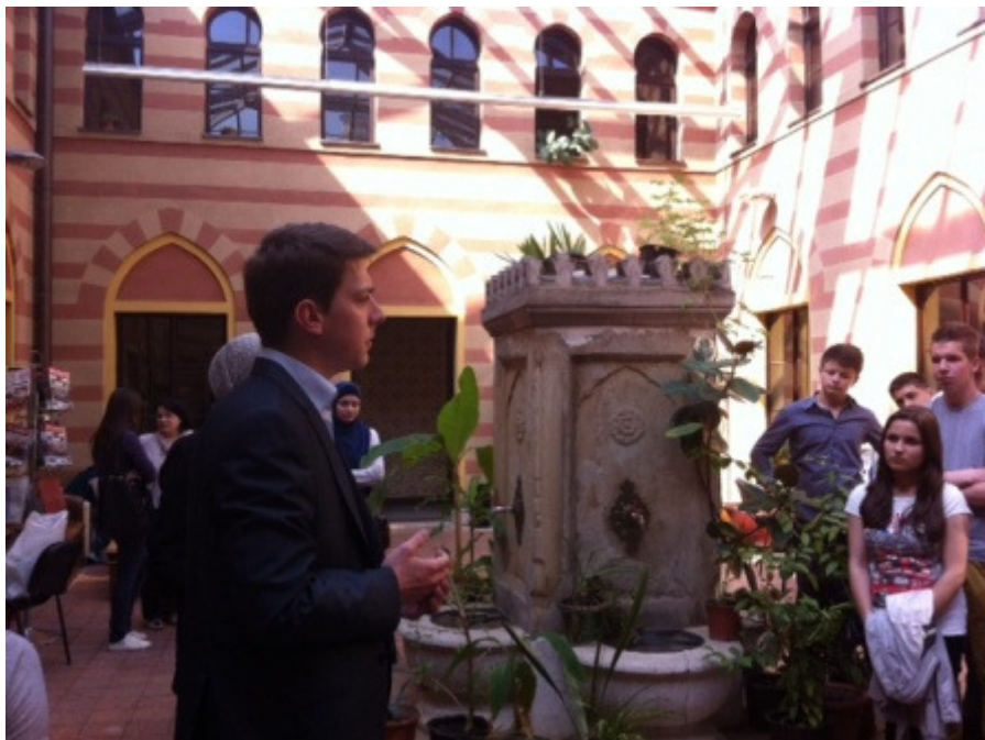
Student treće godine FIN-a upoznaje nas sa studentskim životom