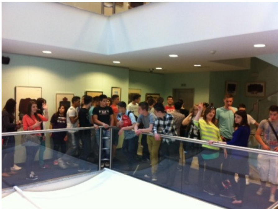
U posjeti Bošnjačkom institutu