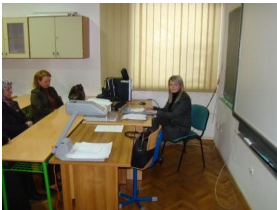
Razrednica 2. razreda i roditelji