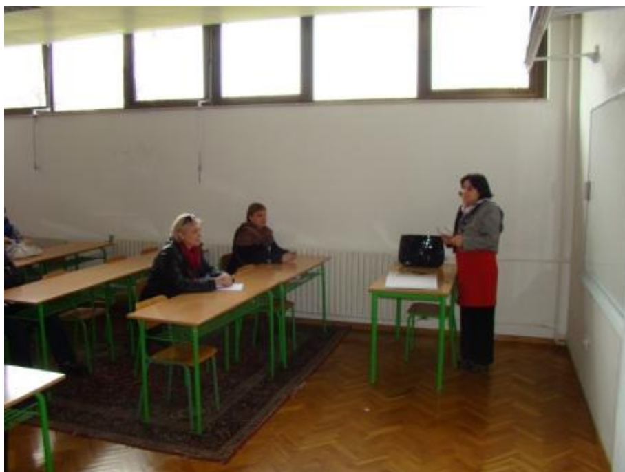
Razrednica 1. razreda i roditelji

Nakon prvog dijela programa, roditelji su se uputili prema razredima, gdje su ih razrednici detaljno upoznali s učenjem i vladanjem njihove djece.