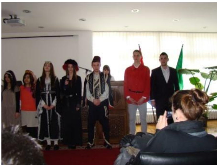
Članovi Dramske sekcije