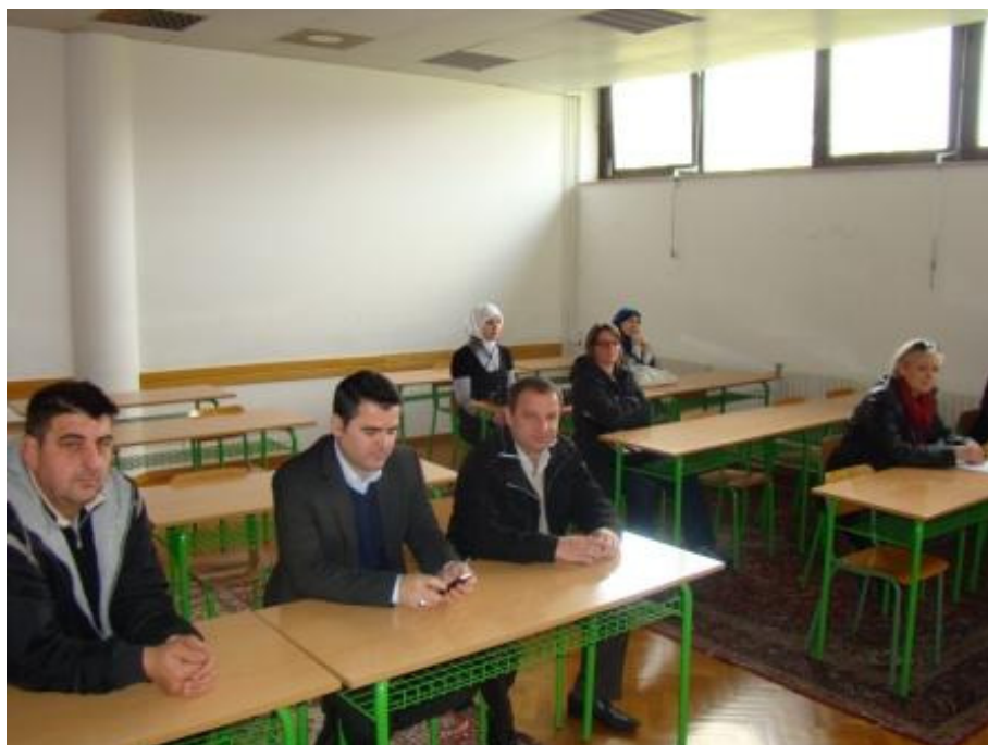
Roditelji učenika 1. razreda