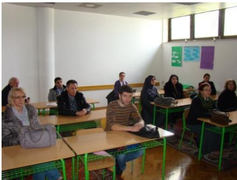
Roditelji učenika 3. razreda