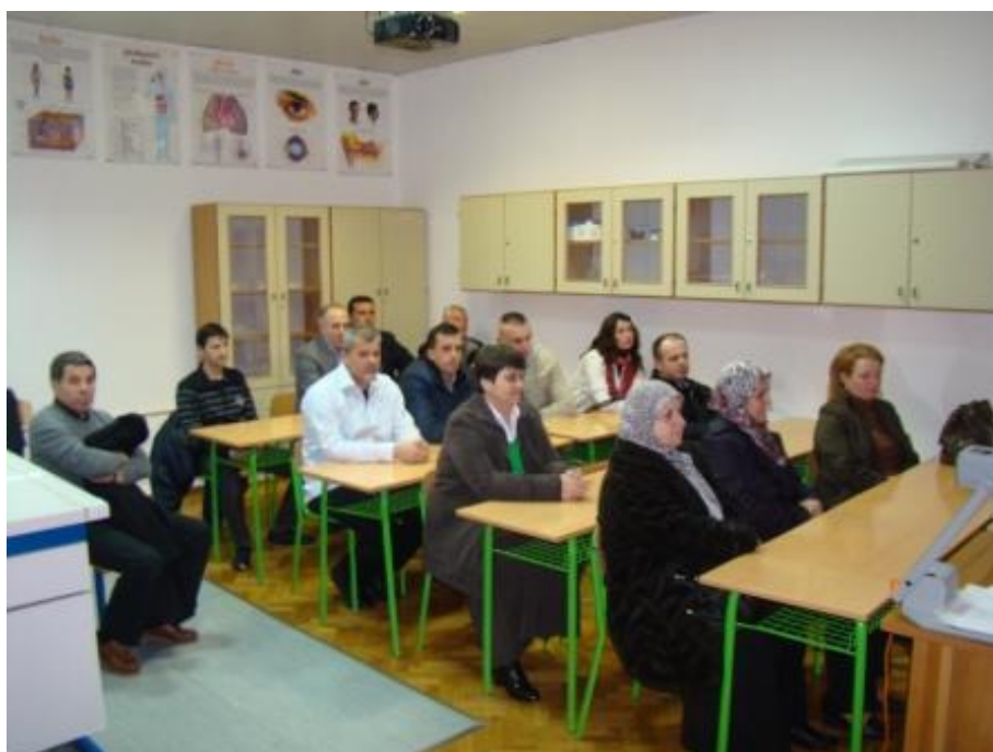
Roditelji učenika 2. razreda