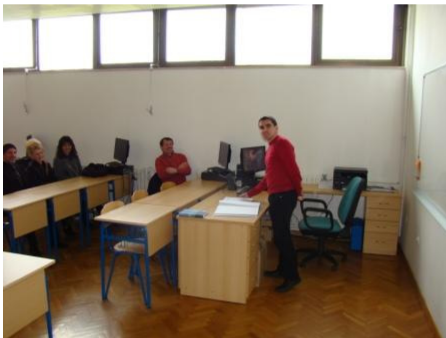
Razrednik 4. razreda i roditelji