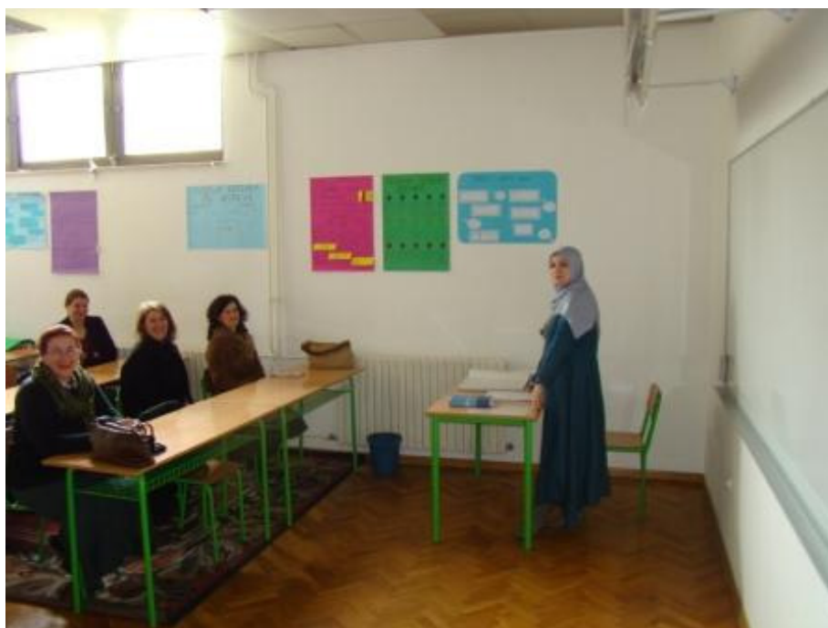
Razrednica 3. razreda i roditelji