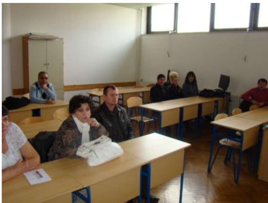
Roditelji učenika 4. razreda

Iako je bila nedjelja, naša je škola imala još jedan lijep radni dan.