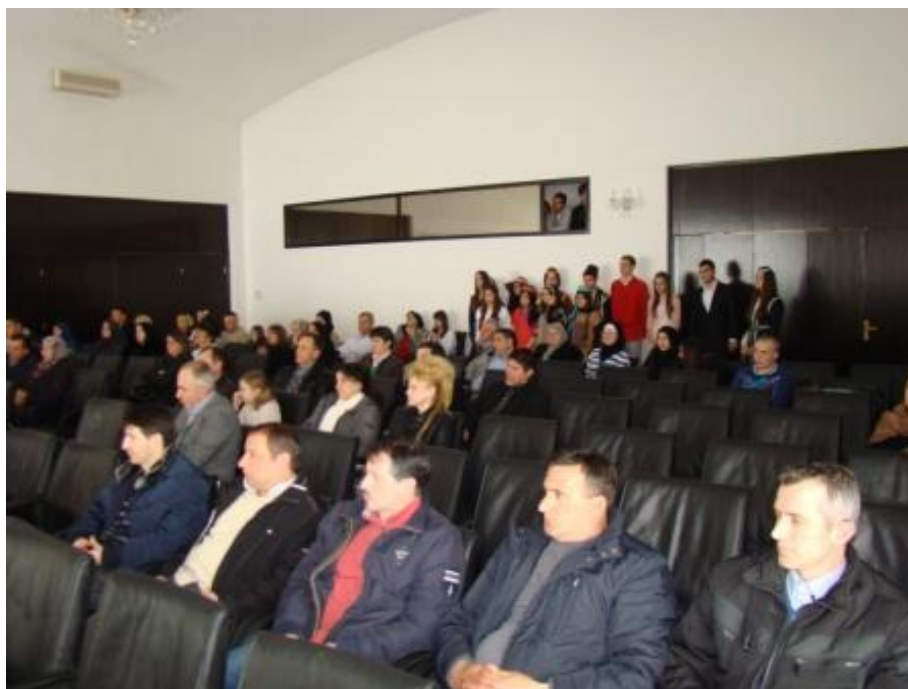
Roditelji naših učenika