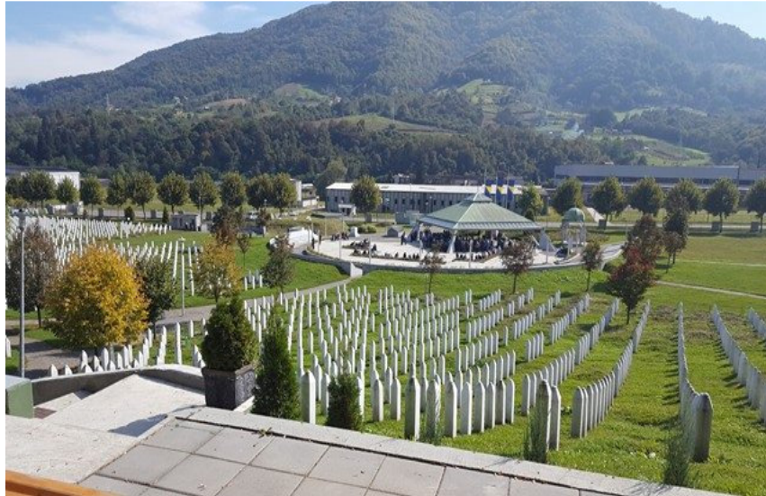
* more nišana *