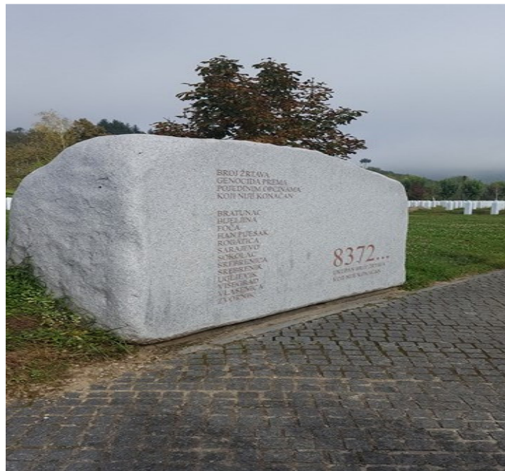
* spomenik žrtvama *