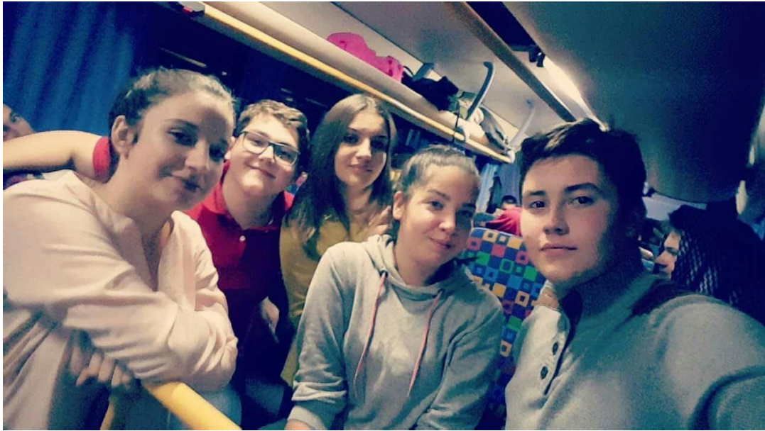
* povratak za Zagreb *