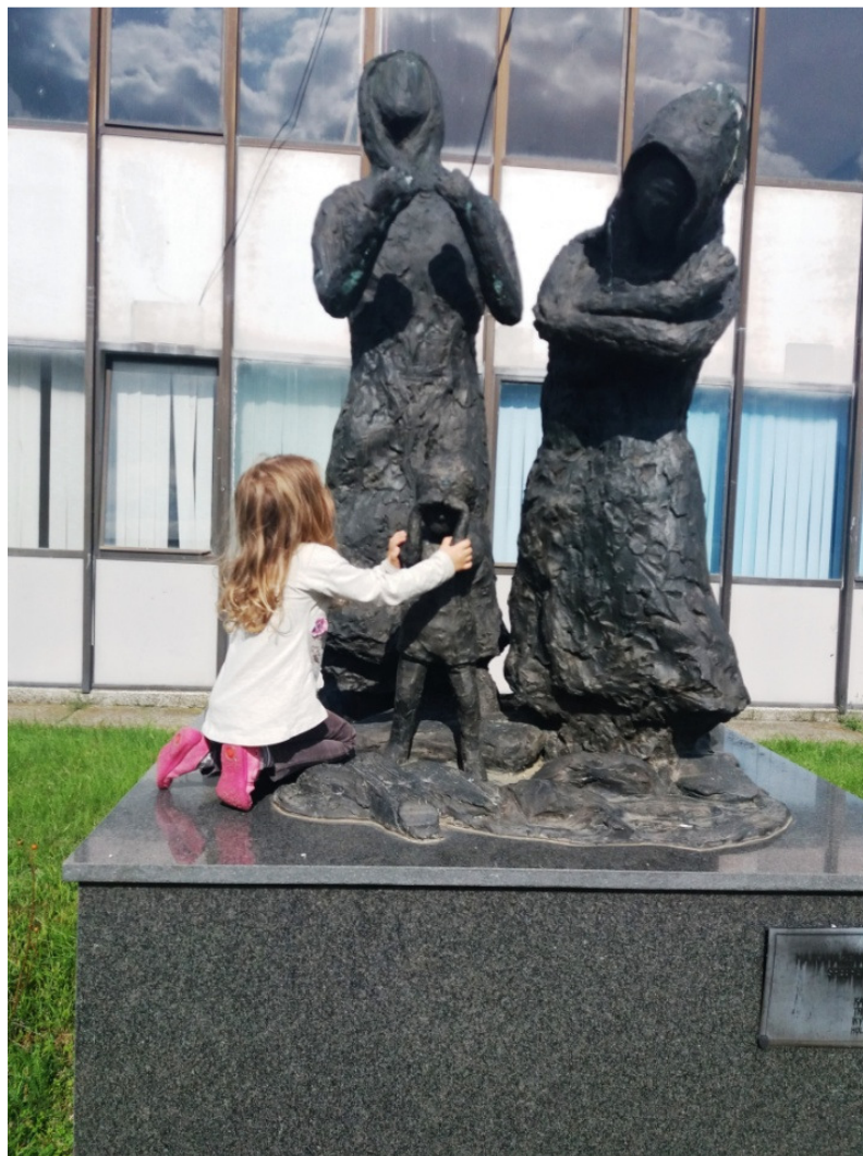
* Dijete „tješi“ dijete Srebrenice. „Spomen ženama, majkama i djeci Srebrenice“ podigli su Nizozemci. *

Iako smo bili potreseni raznim prizorima koje smo imali priliku vidjeti, drago nam je što smo otišli i odali počast žrtvama najvećeg genocida izvršenog nakon Drugog svjetskog rata na našim prostorima.