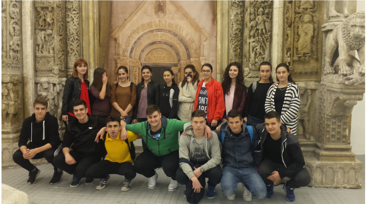
Sl. 5. Ispred Radovanova portala