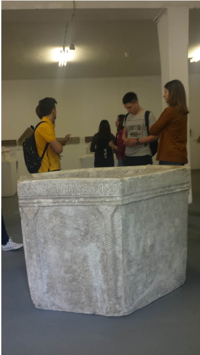
Sl. 2 . Višeslavova krstionica

odnosno, kako je u tekstu navedeno, ledinu. Bašćanska ploča od velike je važnosti zbog toga što je to najstariji dokument na kojem se spominje hrvatsko ime, pisano hrvatskim jezikom i hrvatskim pismom.