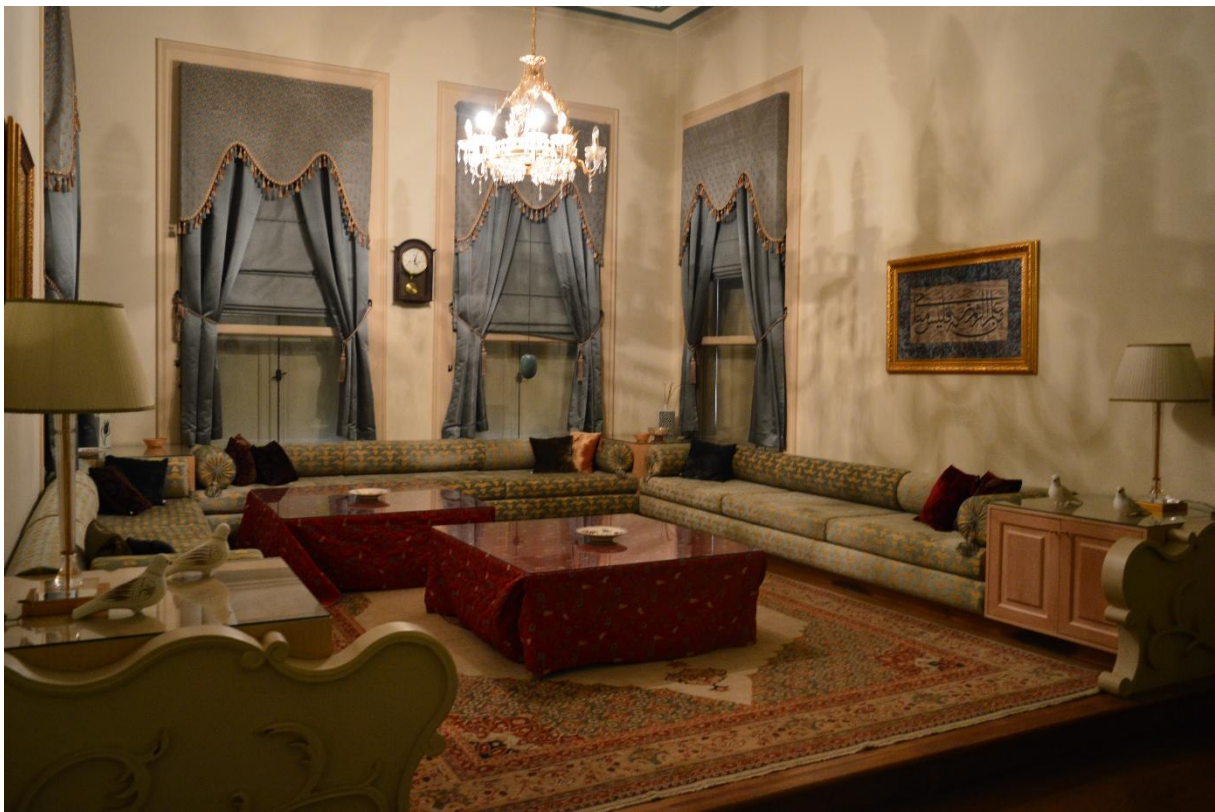
Dvorana u sklopu streljane u osmanlijskom stilu