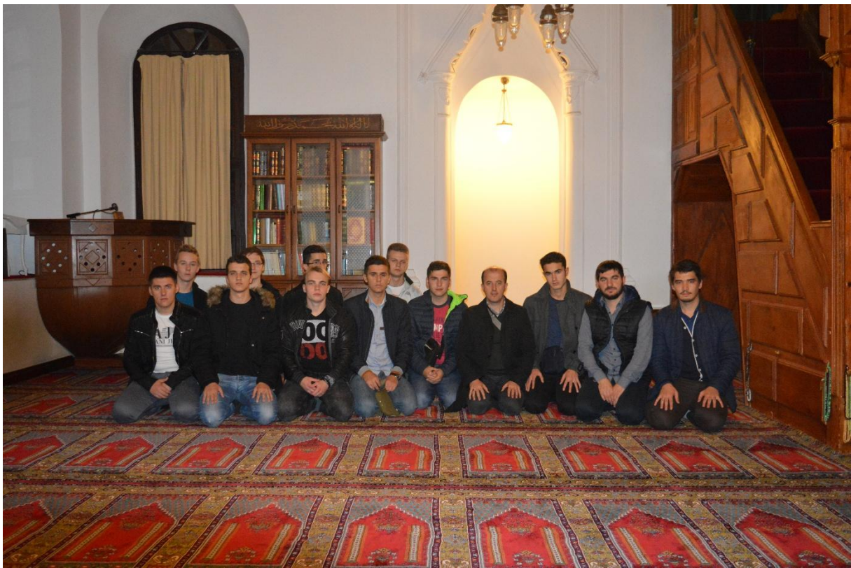
Zajednička fotografija ispred mihraba i minbere žamije sultana Tadžudina