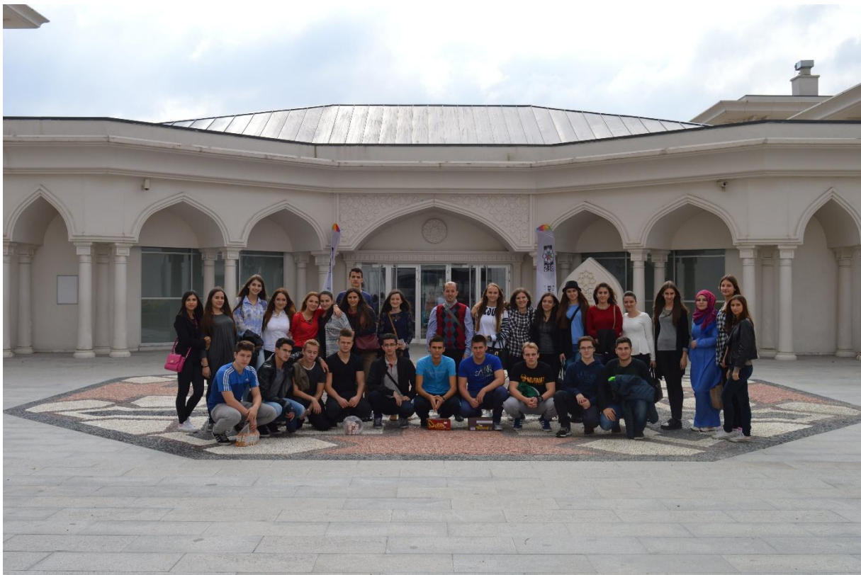
Zajednička fotografija ispred kompleksa

Uputili smo se prema streljačkom klubu Okçular Vakfı, gdje je u doba Osmanlija bila streljana, koja je bila zatvorena stvaranjem Turske Republike. U sklopu kompleksa nalazi se i radionica za izradu luka i strijela na tradicionalni osmanlijski način. Nakon ručka u restoranu kluba, imali smo i ogledni sat o načinu izrade luka i strijele te o načinu gađanja lukom i strijelom.