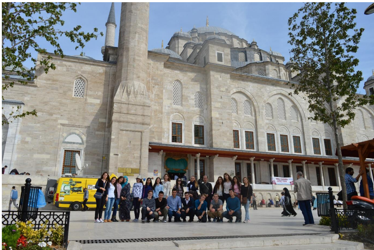
Zajednička fotografija ispred džamije Mehmeda Fatiha

Odmah nakon ručka, otišli smo u džamiju Mehmeda Fatiha, gdje smo u prelijepoj i prepunoj džamiji klanjali džumu namaz.