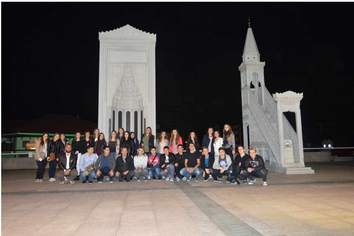
Vanjski mihrab i minber Hadži Bajramove džamije