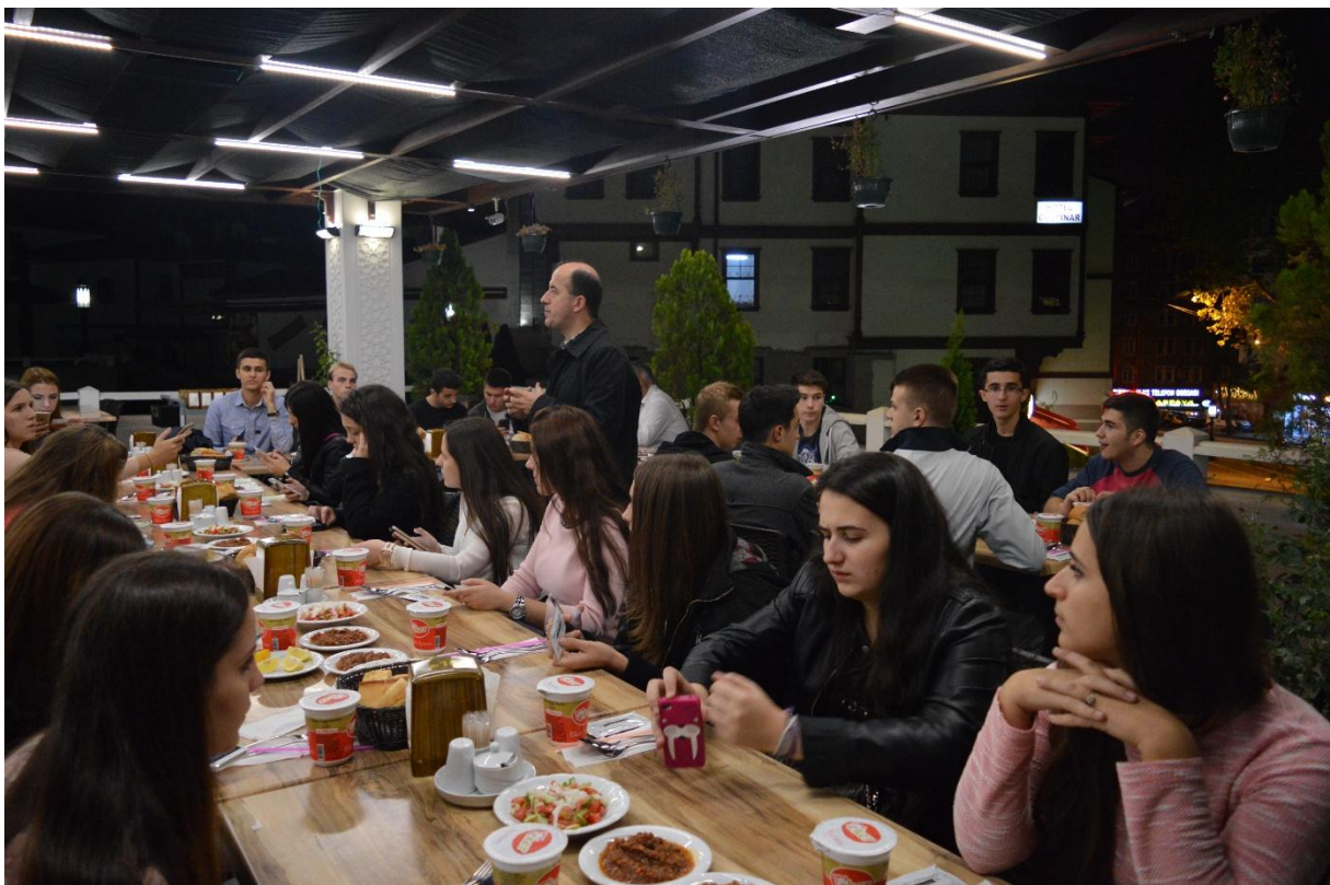
U iščekivanju večere i spajanja na Internet (slab signal ☹)

Nakon večere, odlazimo noćiti u studentski hotel, gdje neki preko mobitela iščekuju rezultate utakmica Malta-Hrvatska 0:1, BiH-Wels 2:0, Italija – Norveška 2:1, a neki gledaju jako važnu utakmicu za Turke (Turska-Irska 1:0). Nakon minimalne pobjede Turske, "gorio" je cijeli grad. Đonlaga, ja, ravnatelj, ljudi i Nursudin bey taj gol dočekali smo u Hitnoj ☺.