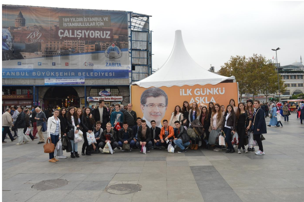
Iako nas nije uživo dočekao, sreli smo ga ispred Egipatske tržnice ☺