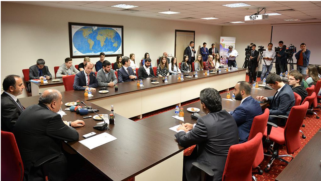
Prijem kod potpredsjednika Vlada g. Tuğrul Türkeş