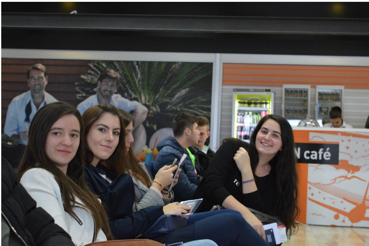
Poziranje prije polaska #1