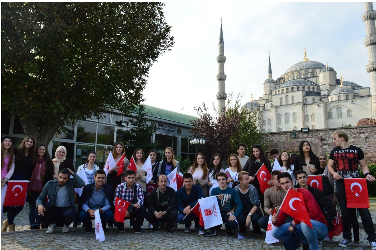
Još jedna fotka prije ukrcaja u bus. Iza nas Sultanahmetova džamija.