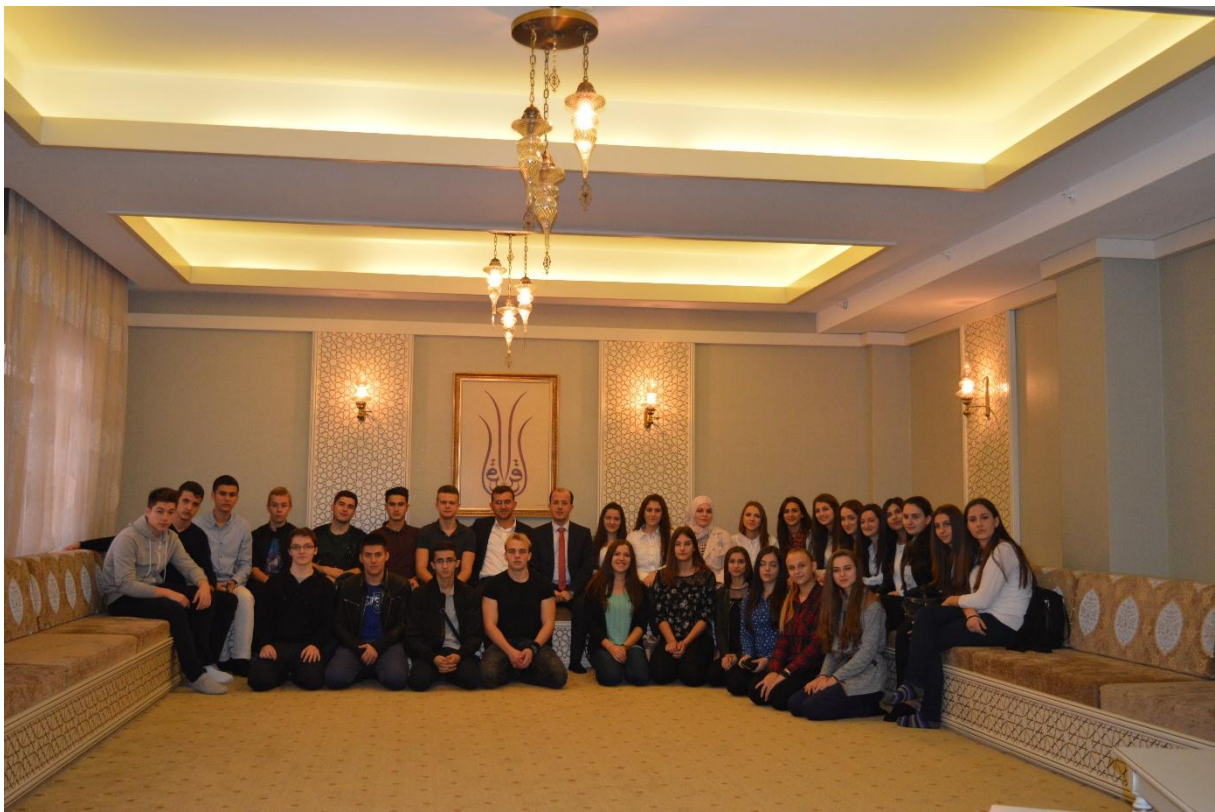
Zajednička fotografija s upraviteljem kompleksa

Zatim smo se uputili prema Predsjedničkoj palači u sklopu koje se nalazi i prelijepa džamija. U njoj smo u džematu klanjali podne i ikindiju namaz.