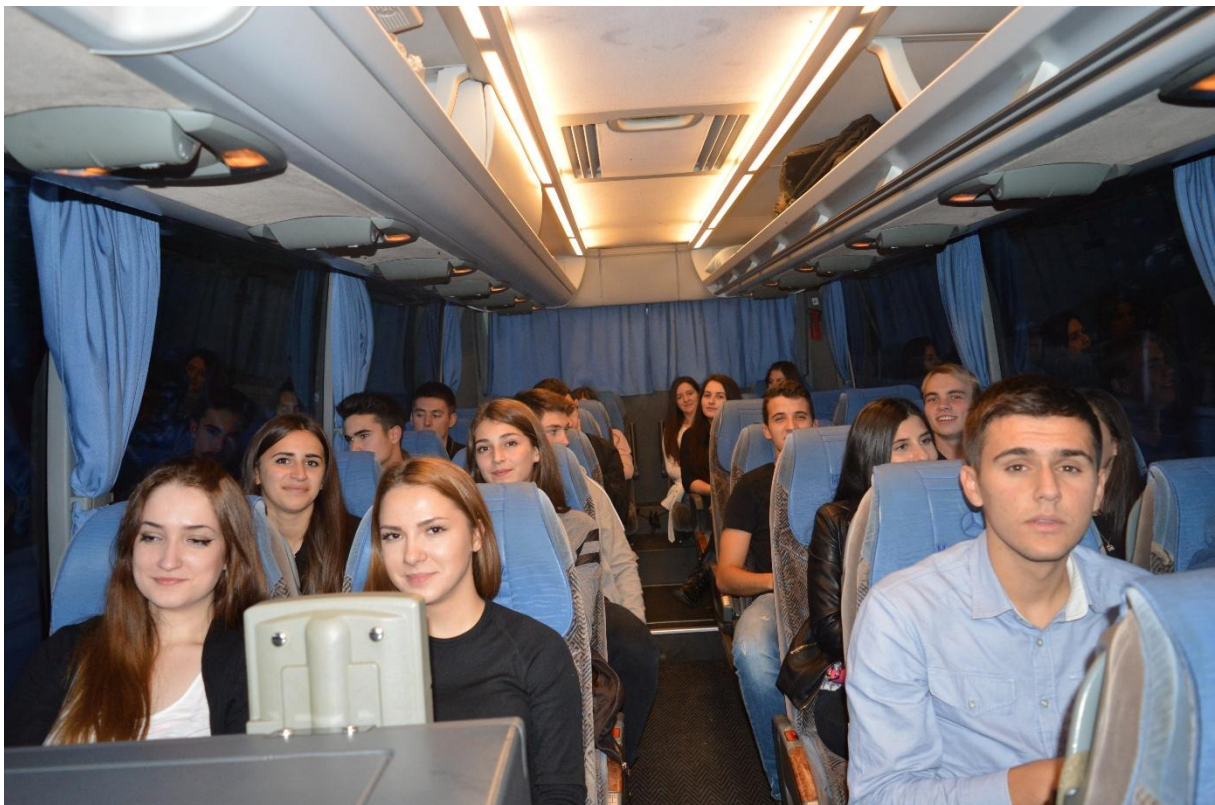
Prošli smo skoro 1.500 km zračne udaljenosti, a umora ni na vidiku

Nakon dolaska u Ankaru, otišli smo klanjati akšam i jaciju namaz u jednoj maloj, ali prelijepoj džamiji Tacettin Sultan Camii ve Türbesi , izgrađena 1610. godine, a nakon namaza uslijedila je večera (turska pita zvana pide ) u čaršiji Hadži Bajram Veli (Hacı Bayram-ı Veli Çarşısı).