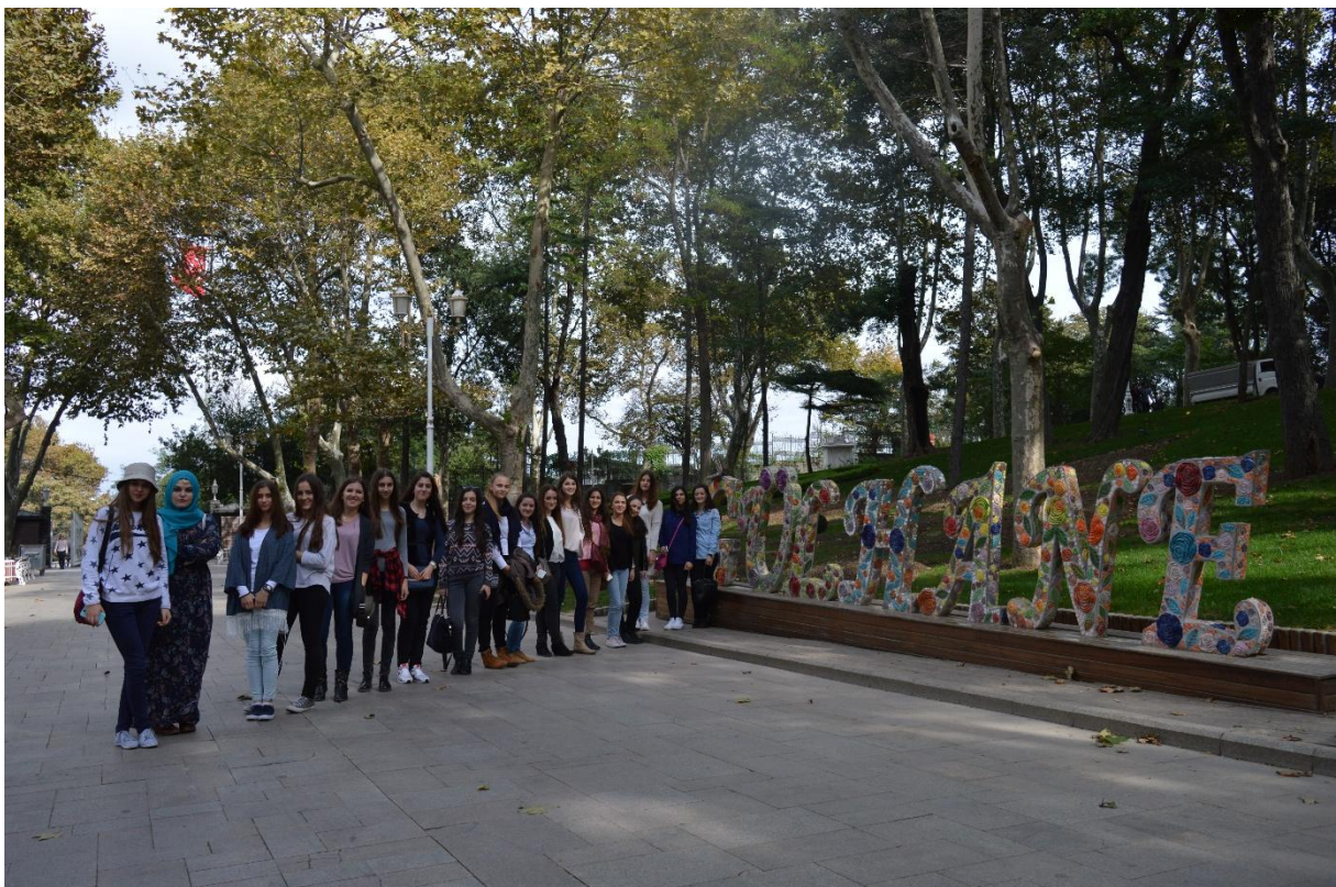
Ovo su naši tulipani

Kako smo odmah klanjali i ikindiju namaz, uputili smo se prema najpoznatijem istanbulskom trgu Sultanahmet , gdje se nalazi najveličanstvenija džamija - Plava džamija (sa šest minareta), Huremin hamam, znamenita Aja Sofija (Sveta Sofija), Yerebatan Sarayı (potopljena palača) odnosno Yerebatan Sarnıcı (potopljena cisterna), Hipodrom i Topkapi palača. Prošli smo kroz najpoznatiji i najstariji park tulipana - Gülhane Park , koji je bio dio Topkapi palače.