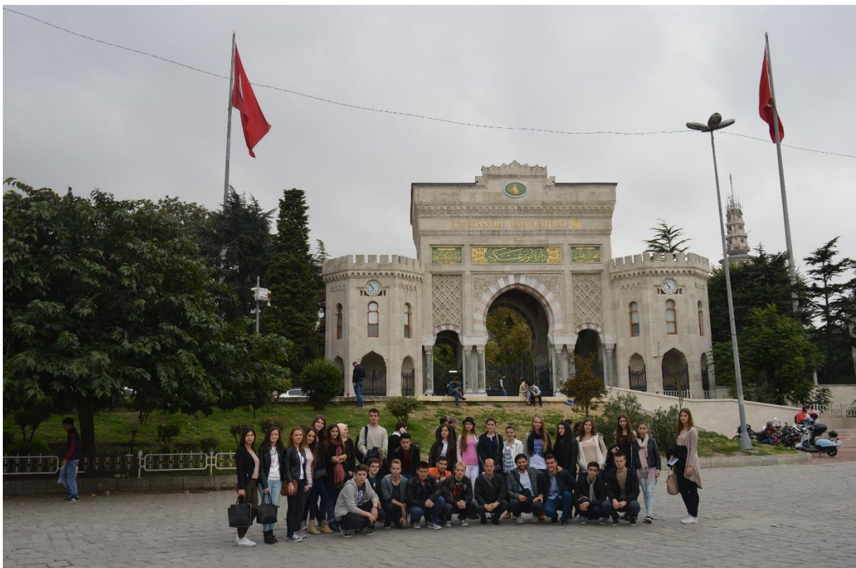
Ispred Istanbulskog sveučilišta, a u blizini Kapali čaršije

Rano ujutro uputili smo se u središte trgovine (Kapali čarši i Egipatsku tržnicu). S obzirom da nam je sve bilo besplatno, na nama je bilo potrošiti naše džeparce.