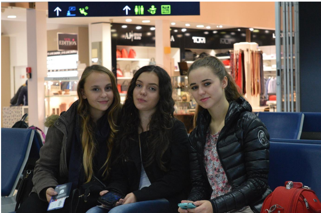
Poziranje prije polaska #2