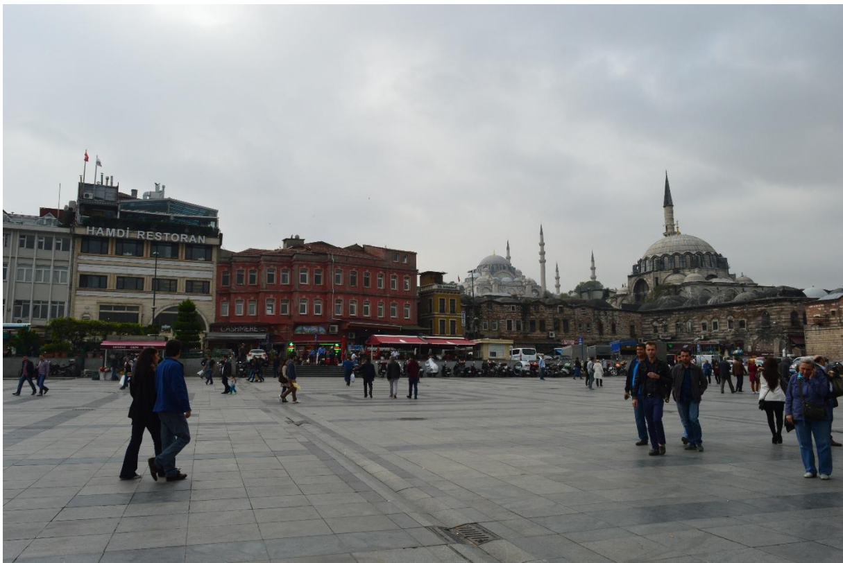
Naim je još u džamiji Sulejmana Veličanstvenoga (gore-lijeva)