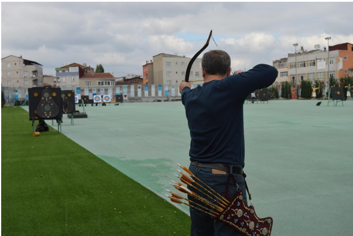
Demonstracija gađanja lukom i strijelom