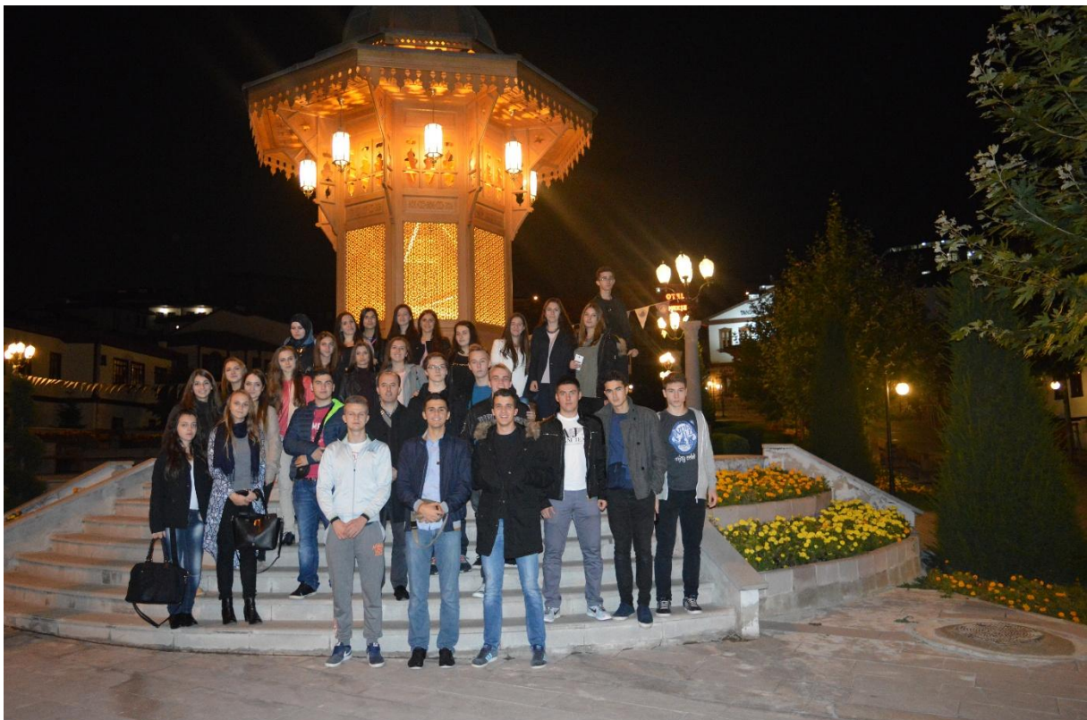
Sarajevo?! / Ankara?!