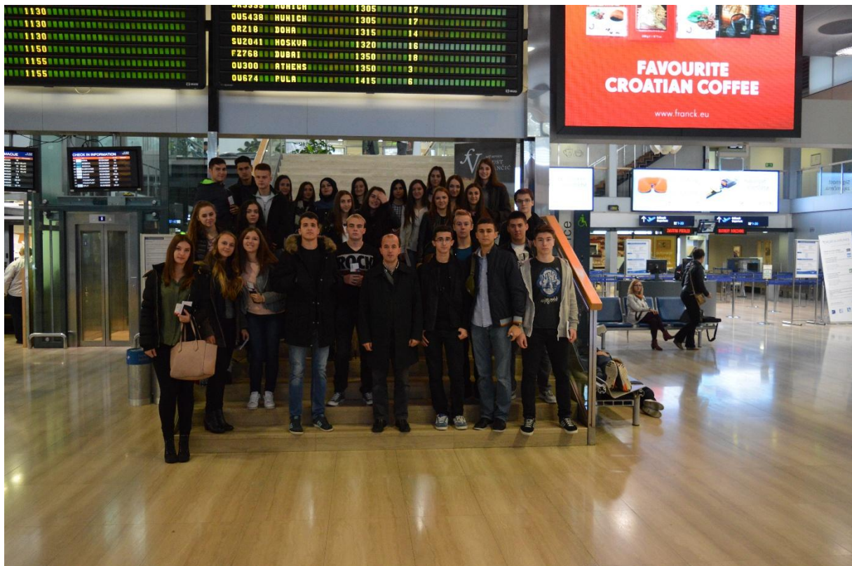
Zajednička fotografija pred sami polazak na Zagrebačkom aerodromu

Kako nam je let za Istanbul bio u 11h, dogovorili smo se da se u 9h nađemo na aerodromu. Tako i bi. Svi smo na vrijeme došli.