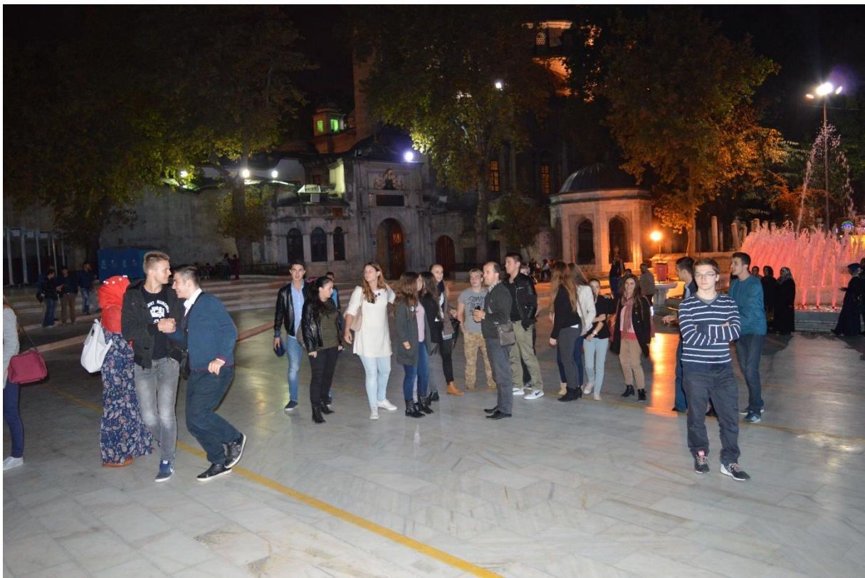
Svatko na svoju stranu