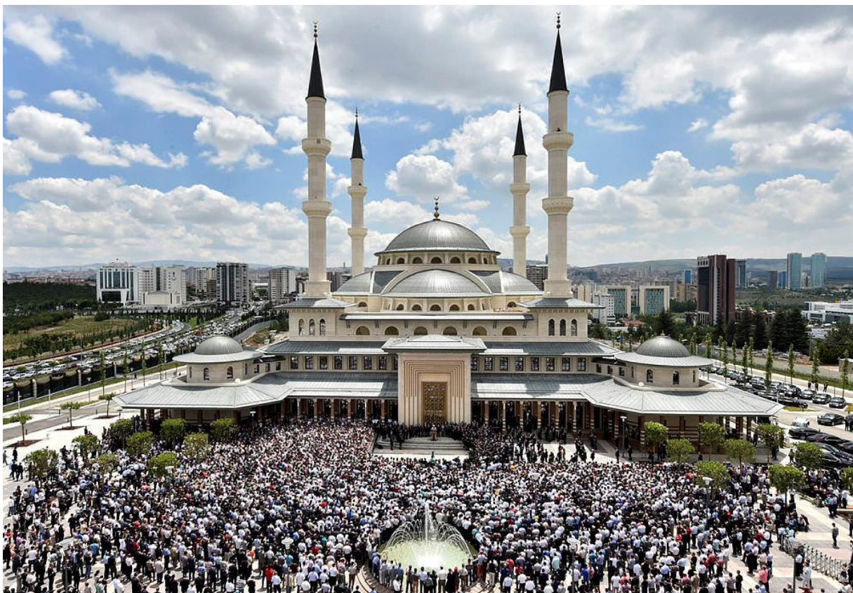
Džamija u sklopu Predsjedničke palače

Zatim smo se uputili prema Predsjedničkoj palači u sklopu koje se nalazi i prelijepa džamija. U njoj smo u džematu klanjali podne i ikindiju namaz.