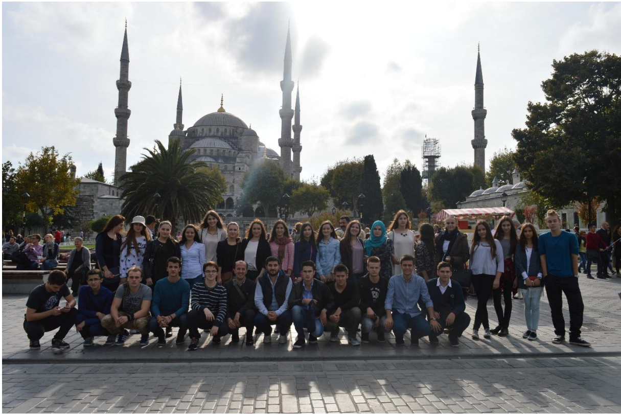
Zajednička fotografija ispred džamije Sultanahmet

... i ispred Plave džamije ili Sultanahmetove džamije. Smatra se da je broj minareta proizišao iz nesporazuma između arhitekta i sultana, koji je tražio zlatne (altın) minarete, a dobio šest (altı) minareta.