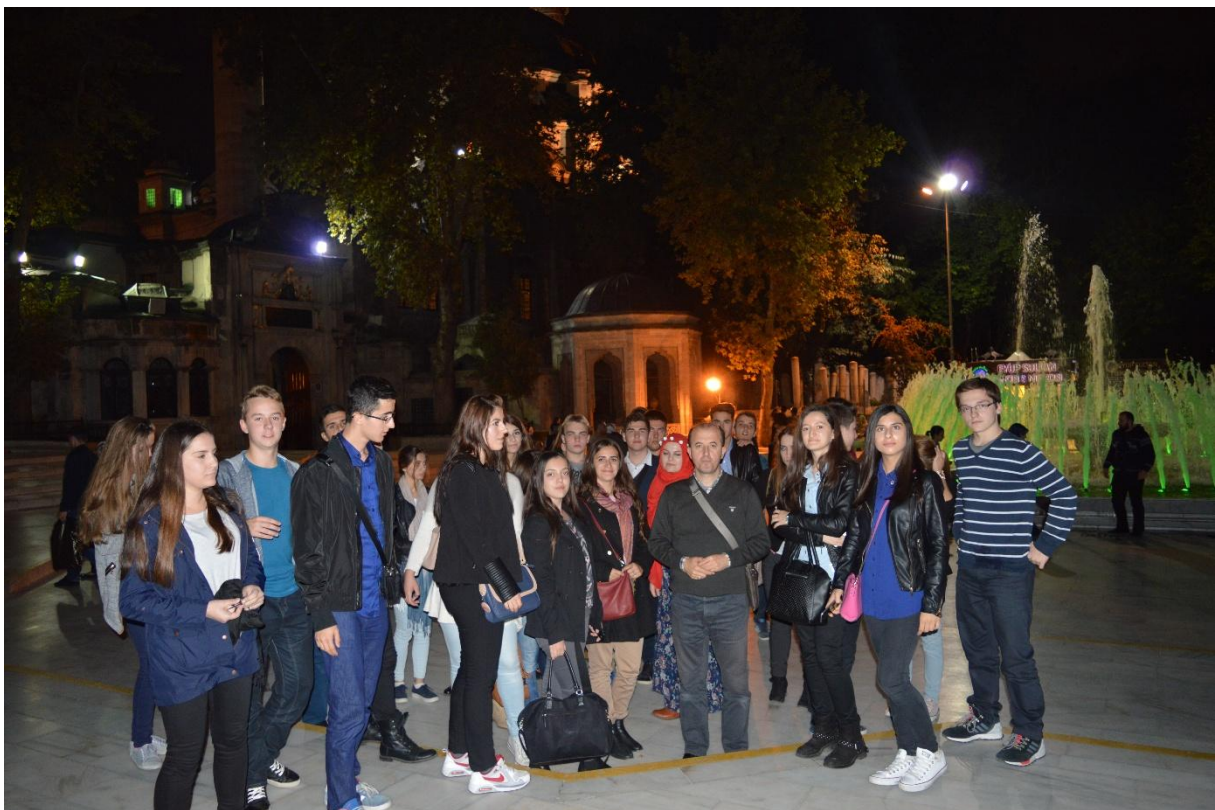
Ispred Ejubije džamije

Prije odlaska u hotel, obavili smo mali šoping u krugu džamije Ejubije, gdje je pokopan ashab Ejub el-Ensari te nekolicina velikih vezira iz Jugoistočne Europe. Tu leži i čuveni vezir Mehmed-paša Sokolović.