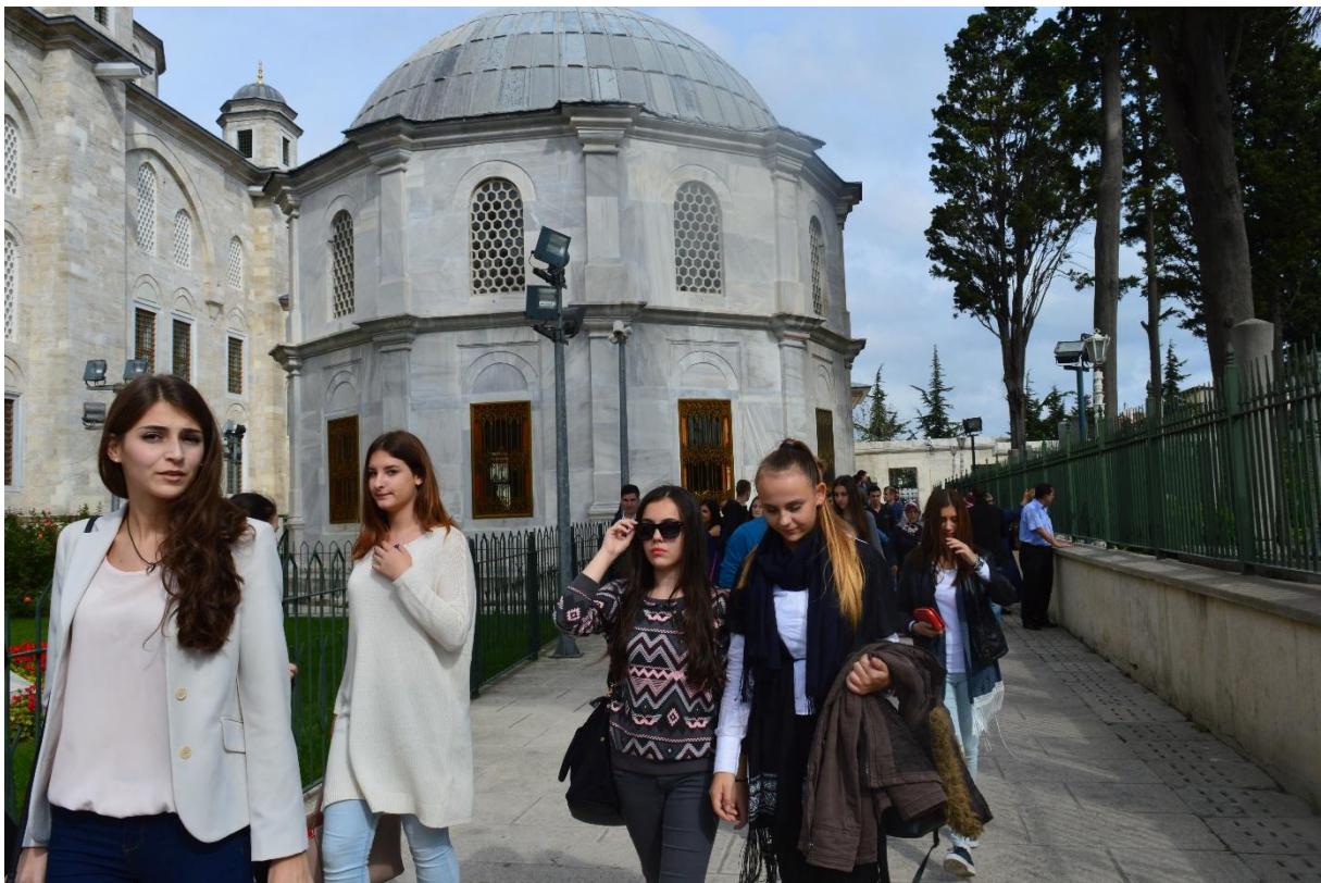
Napuštamo turbe sultana Mehmeda Fatiha

Kako smo odmah klanjali i ikindiju namaz, uputili smo se prema najpoznatijem istanbulskom trgu Sultanahmet , gdje se nalazi najveličanstvenija džamija - Plava džamija (sa šest minareta), Huremin hamam, znamenita Aja Sofija (Sveta Sofija), Yerebatan Sarayı (potopljena palača) odnosno Yerebatan Sarnıcı (potopljena cisterna), Hipodrom i Topkapi palača. Prošli smo kroz najpoznatiji i najstariji park tulipana - Gülhane Park , koji je bio dio Topkapi palače.