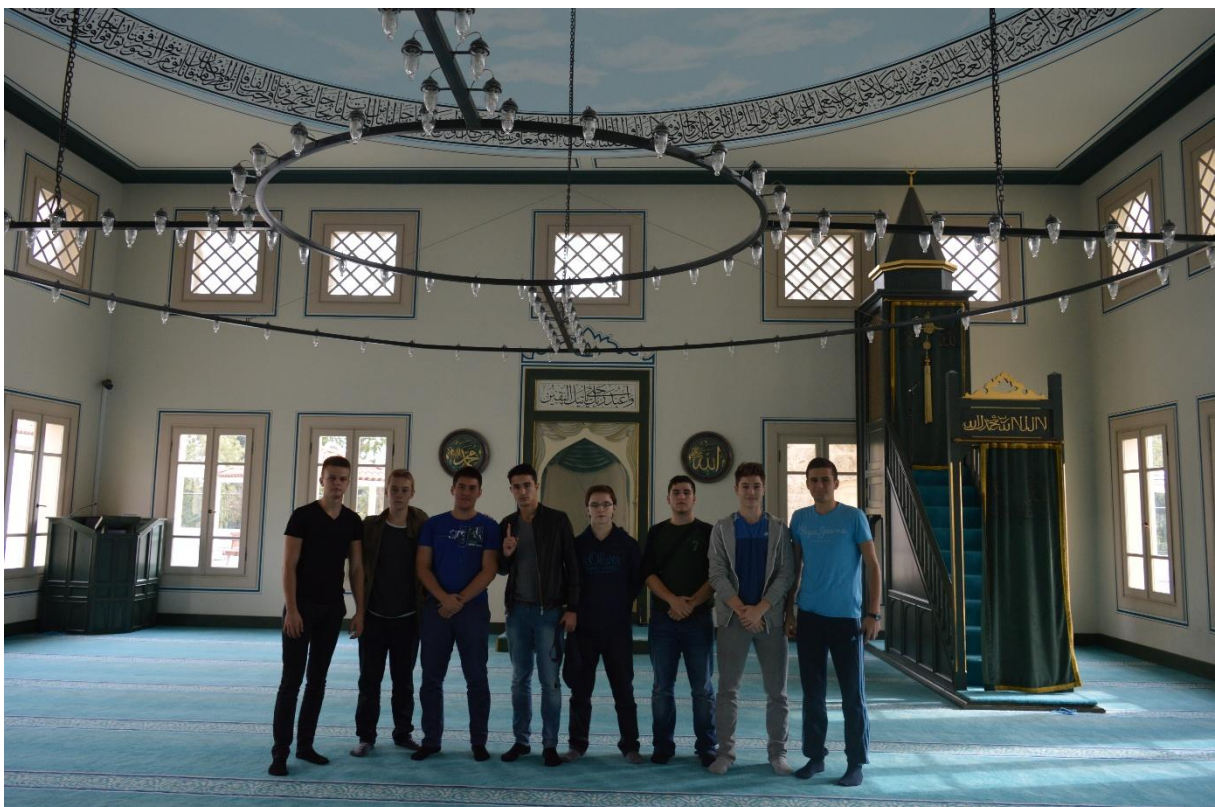
Džamija u sklopu streljane, gdje smo klanjali podne i ikindiju namaz

Nakon streljačkog kluba Okçular Vakfı, krenuli smo prema Miniaturku, gdje se nalaze minijature građevina iz svih razdoblja turske povijesti i anadolske civilizacije.