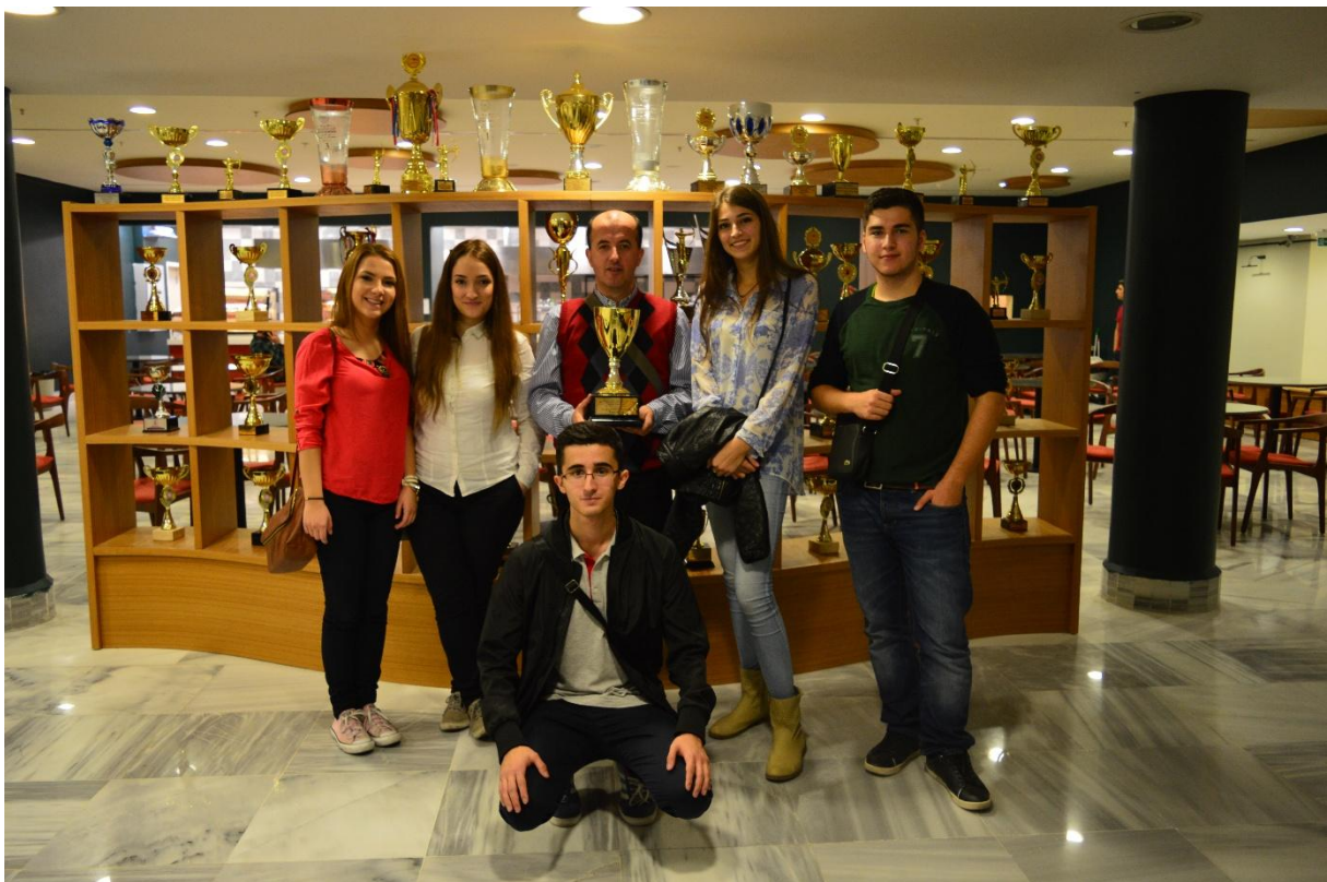
Ispred vitrine s peharima