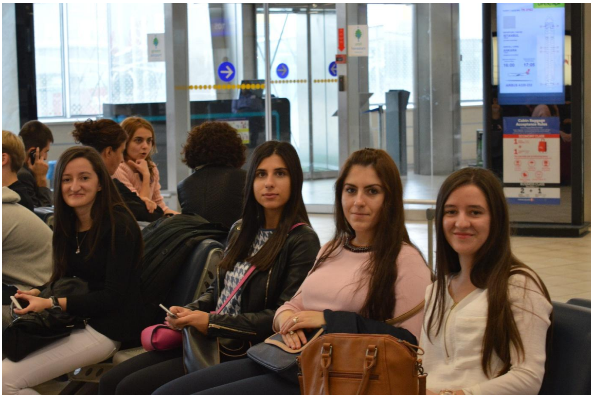
U iščekivanju leta za Ankaru

Dok smo čekali avion, iskoristili smo priliku da u džematu klanjamo podne i ikindiju namaz kao musafiri u mesdžidu. Nakon 20-ak minuta kašnjenja, svi smo, sretni i veseli, se ukrcali u avion.