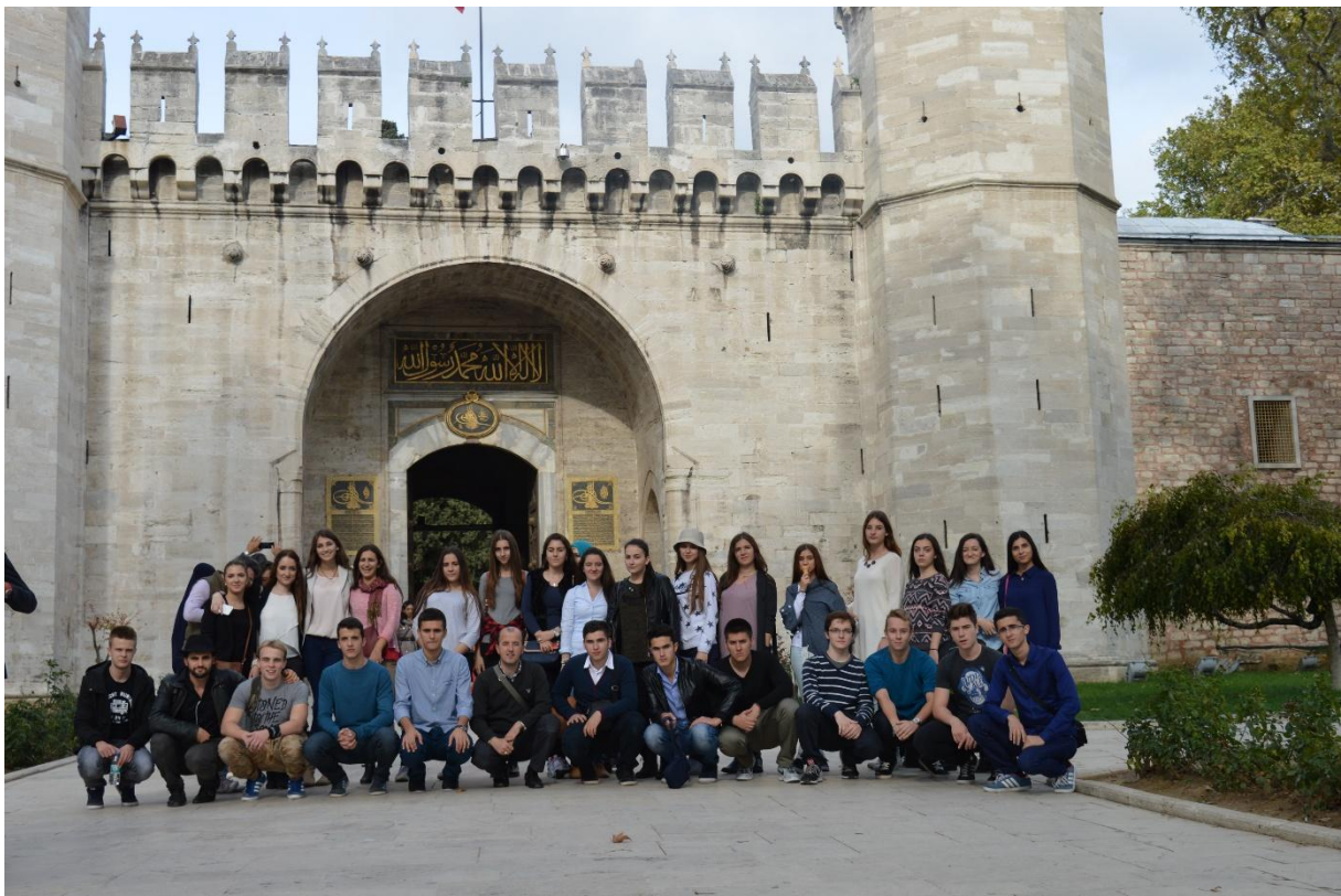
Ispred Vrata pozdrava (Babus-selam)