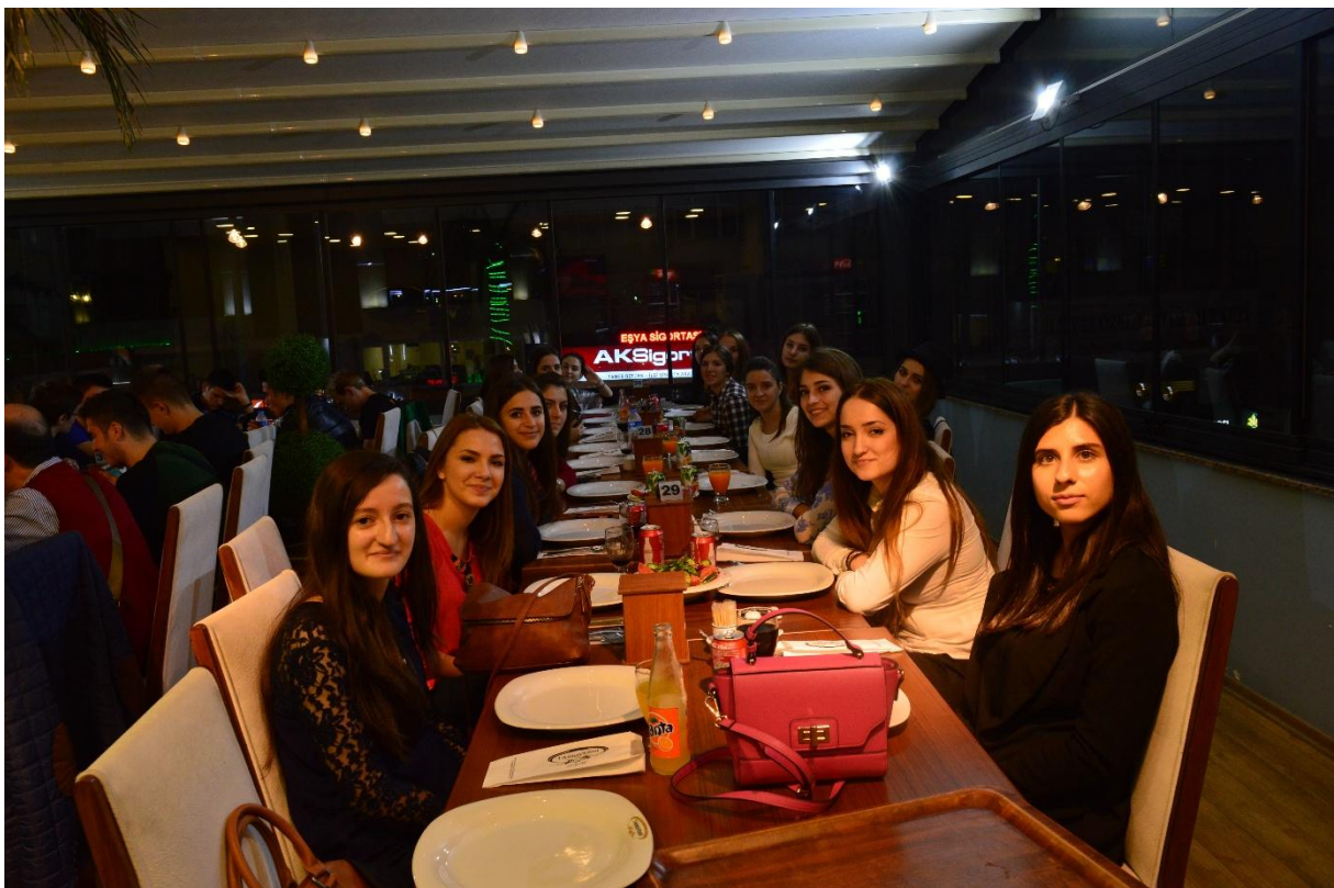
Večera u restoranu IPEK blizu Panorame 1453