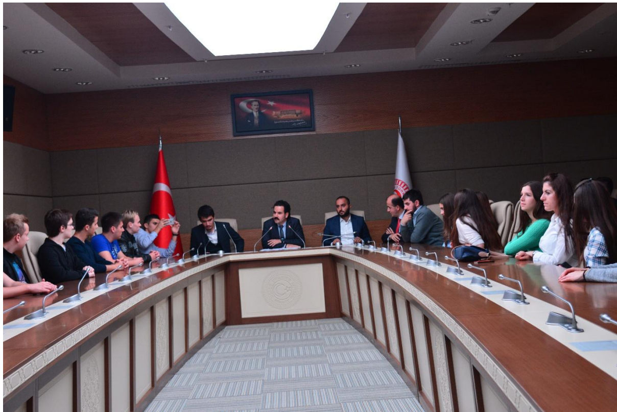
Naši budući parlamentarci 😊

Prije polaska za Istanbul, posjetili smo i Turski parlament. Jako ljubazni službenik Parlamenta održao nam je školski sat na temu „Političko uređenje država“, gdje su naše kolegice i kolege pokazali zavidnu razinu znanja iz politike. Nakon sata, uslijedio je obilazak Parlamenta uz stručno vodstvo.