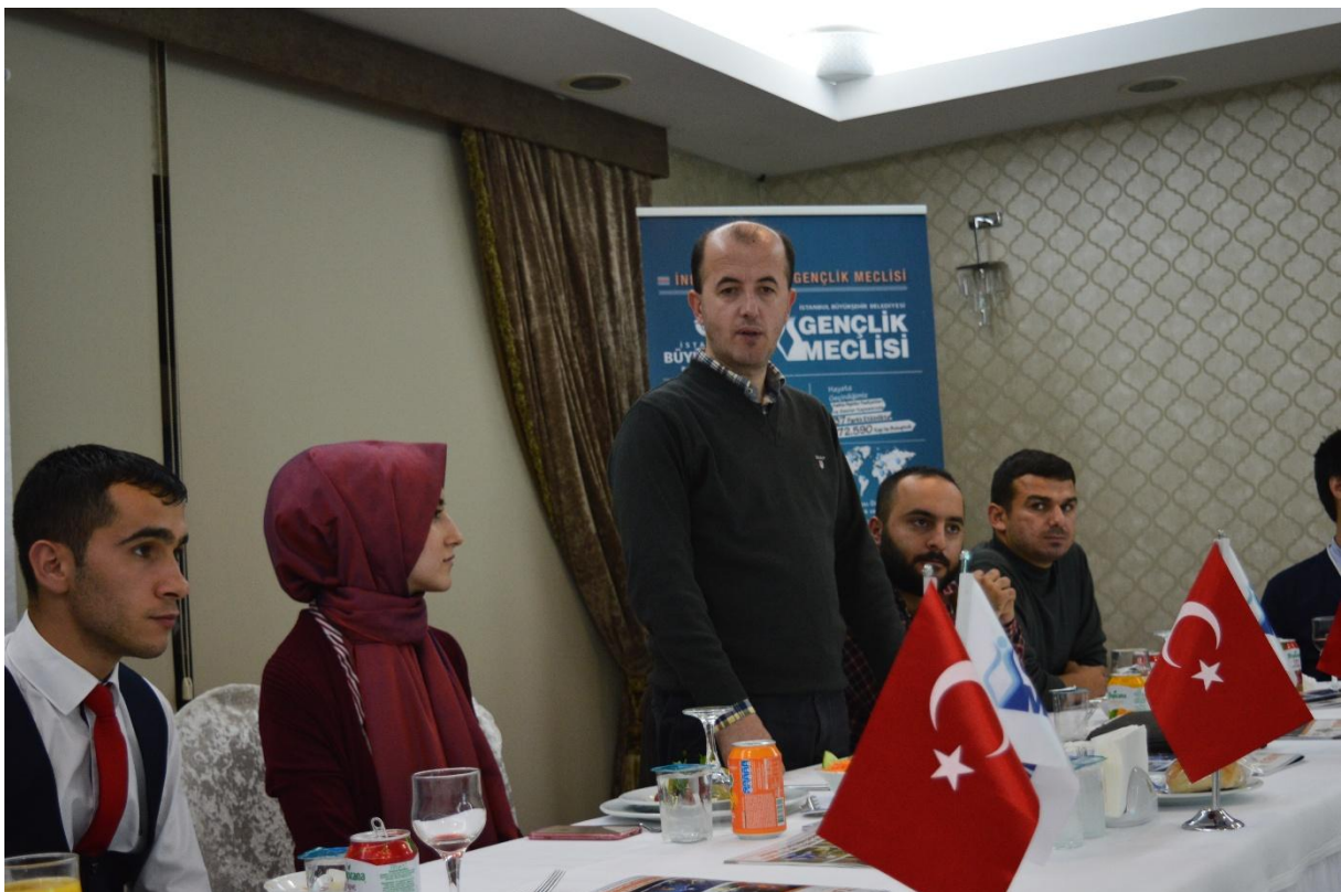
Ravnatelj se zahvaljuje našim domaćinima