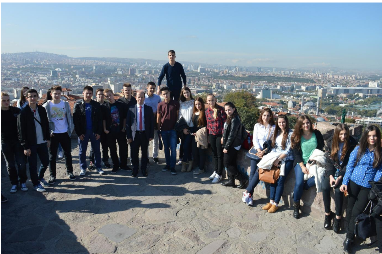
Zajednička fotografija na tvrđavi Ankare

Nakon doručka u hotelu, uputili smo se prema tvrđavi Ankare, koja pruža fantastičan pogled na grad.