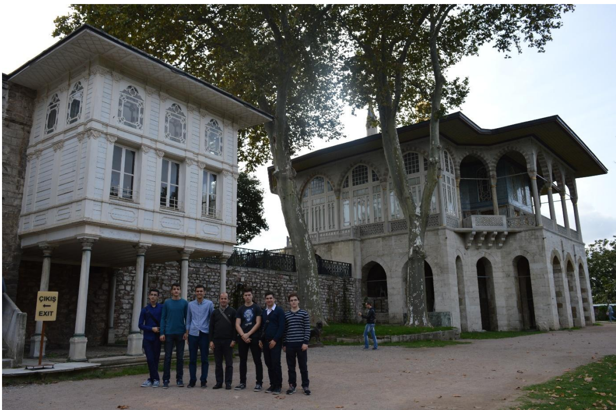
Unutrašnjost Topkapi palače