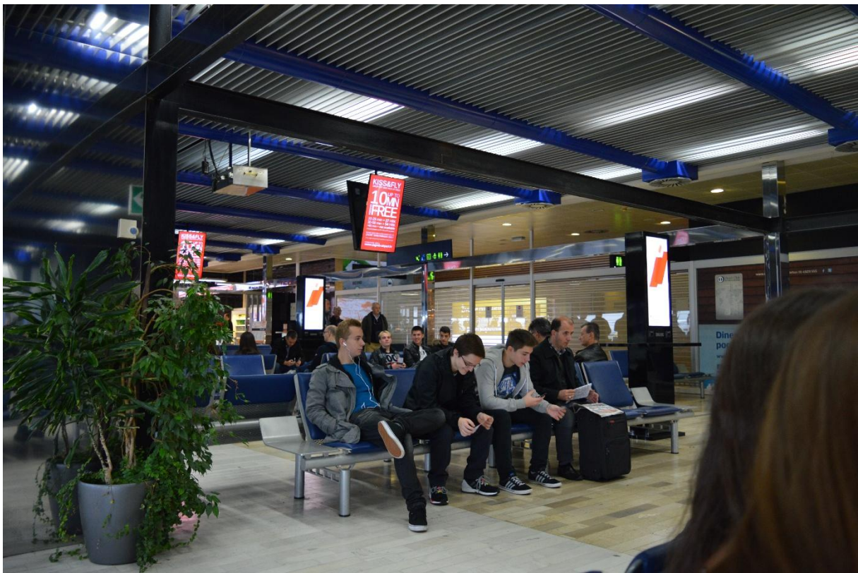
Dečki surfaju, slušaju glazbu i pripremaju se za let

Letjeli smo s Turkish Airlines-om, koji je u lipnju ove godine, na osnovu rezultata ankete sprovedene među 13 milijuna putnika pripadnika 112 različitih nacija, u razdoblju od svibnja 2014. do siječnja 2015. godine, po peti put izabran za najbolju avio-kompaniju u Europi.