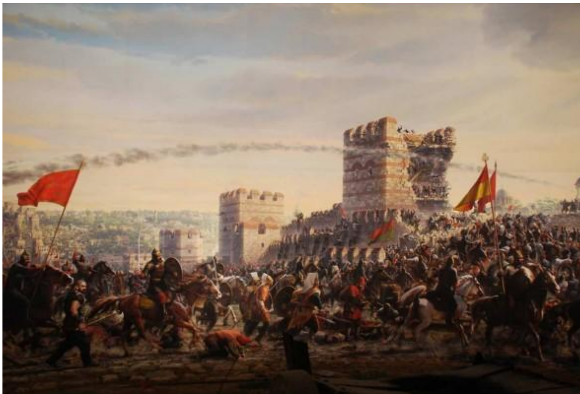
Unutrašnjost Panorame 1453

zidina, vojnika kako saljevaju vruć katran... U pozadini se nalaze replike topova korištenih za razbijanje zidova, a na zapadnoj strani se može uočiti i sam sultan Mehmed Fatih na bijelom konju.