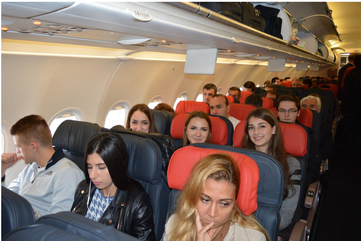
Dio učenica i učenika u kabini aviona s nestrpljenjem čekaju poletanje aviona. Imamo i uljeza.