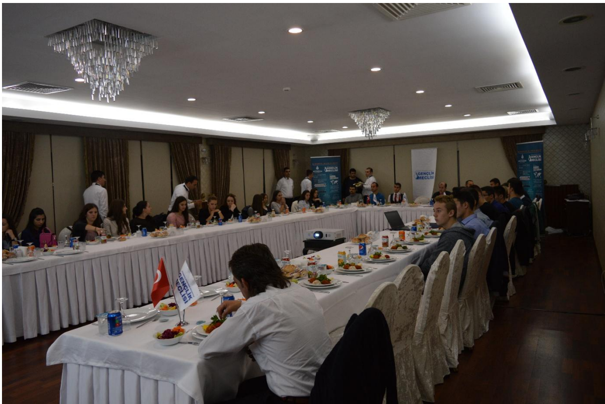
Za bogatom sofrom