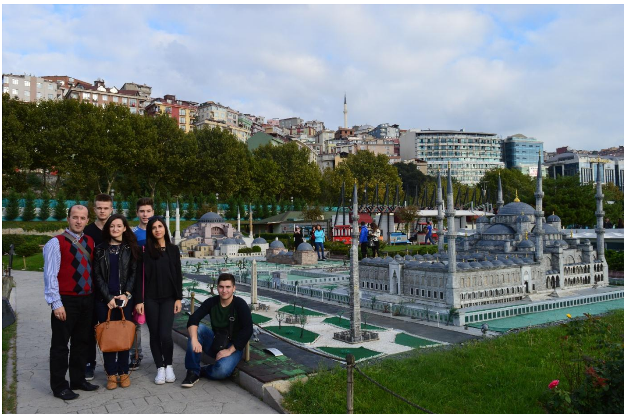
Minijatura trga Sultanahmeta

U popodnevним satima uputili smo se prema Povijesnom muzeju Panorama 1453 , koji zorno oživljava osvajanje Istanbula 29. svibnja 1453. god. Smatra se najvećim panoramskim muzejom na svijetu. Muzej je svečano otvoren 31. siječnja 2009. god. Unutar muzeja nalazi se ogromna kupola na čijih su 360 stupnjeva oslikani detalji opsade poput: mačevanja, bizantinskih strijelaca kako odapinju strijele sa