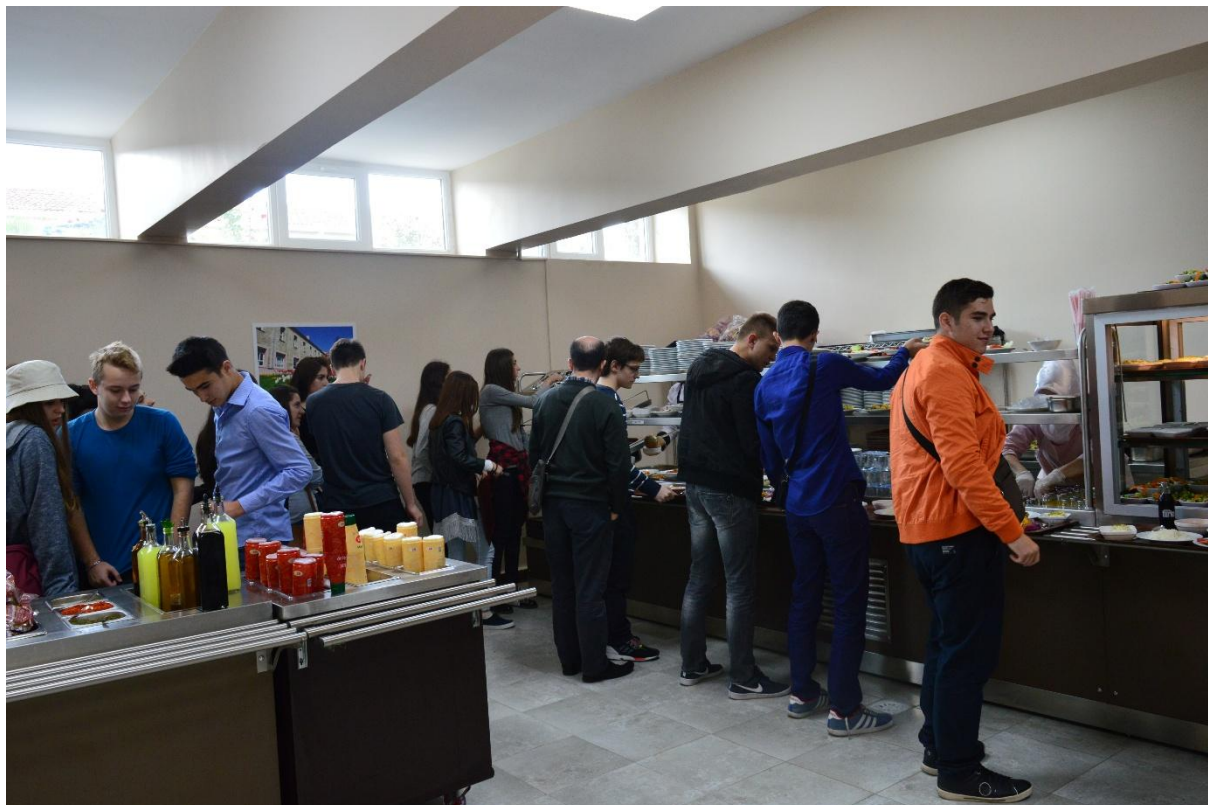
U studenntskom retoranu

studiranja. Kako bi nam dočarali što njihovi studenti jedu, za ručak su nas odveli u studentski restoran. Bilo je fino i ukusno jelo.