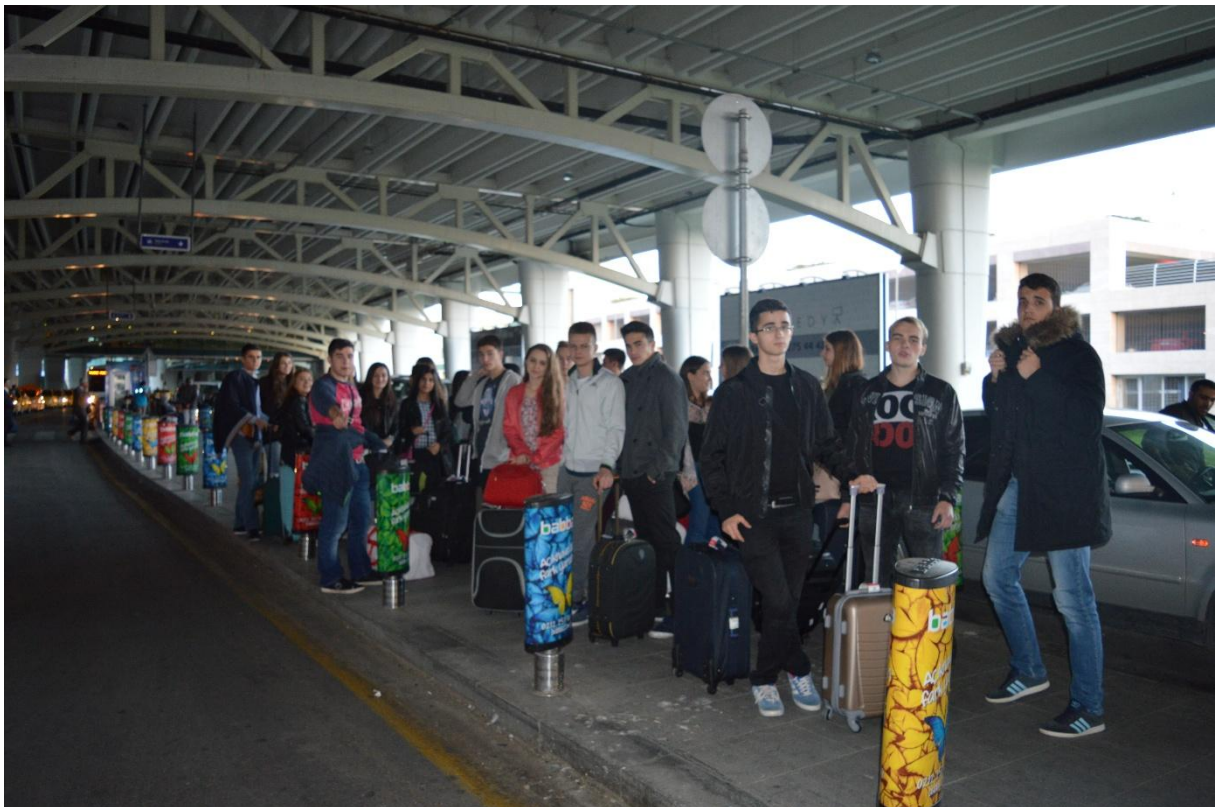
Dok čekamo autobus na izlazu iz aerodroma