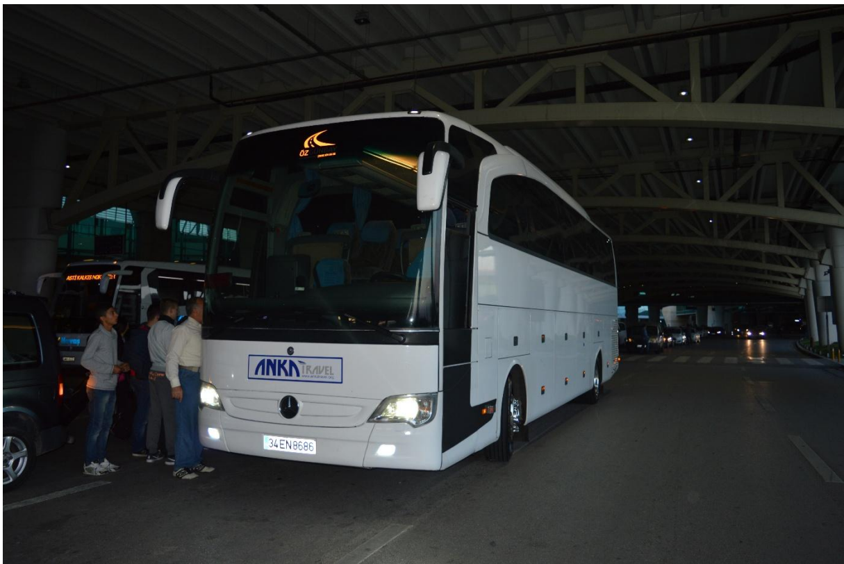
Stigla je naša „mečka“, autobus s wi-fijom, ali mi to nismo znali