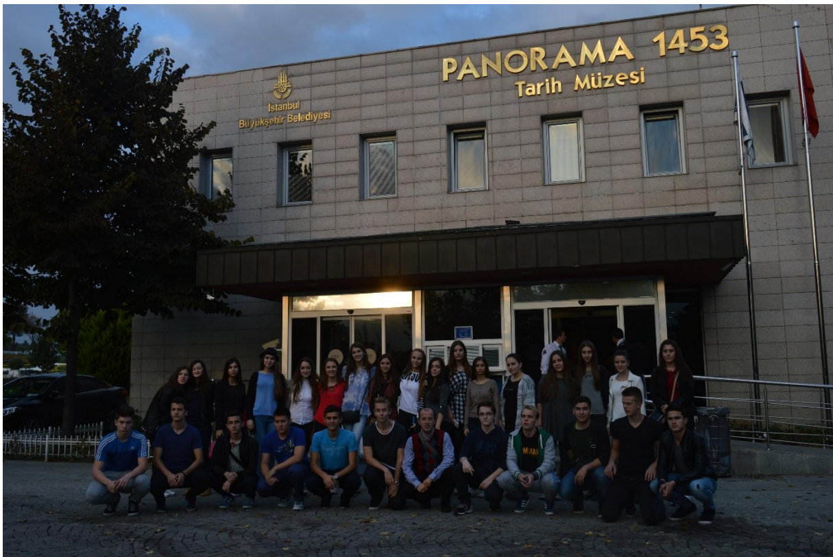
Zajednička fotografija ispred Povijesnog muzeja Panorama 1453