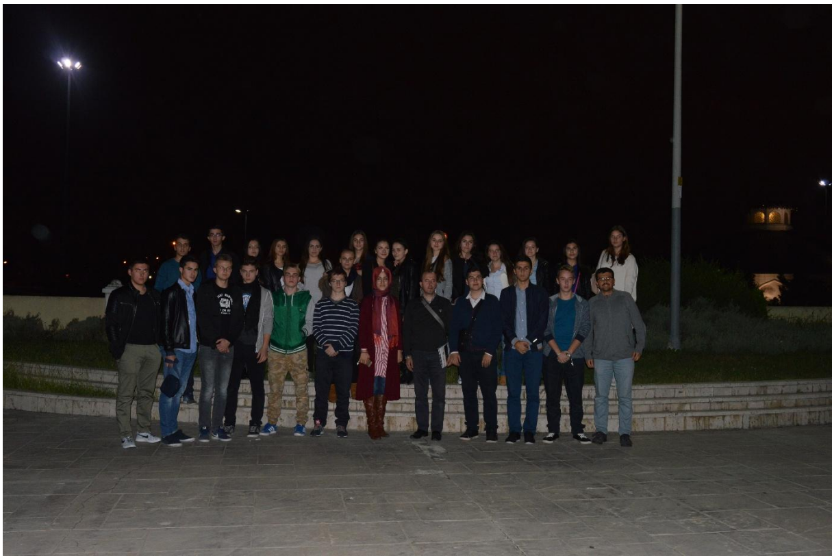
Oproštajna fotografija s domaćinima

Prije odlaska u hotel, obavili smo mali šoping u krugu džamije Ejubije, gdje je pokopan ashab Ejub el-Ensari te nekolicina velikih vezira iz Jugoistočne Europe. Tu leži i čuveni vezir Mehmed-paša Sokolović.