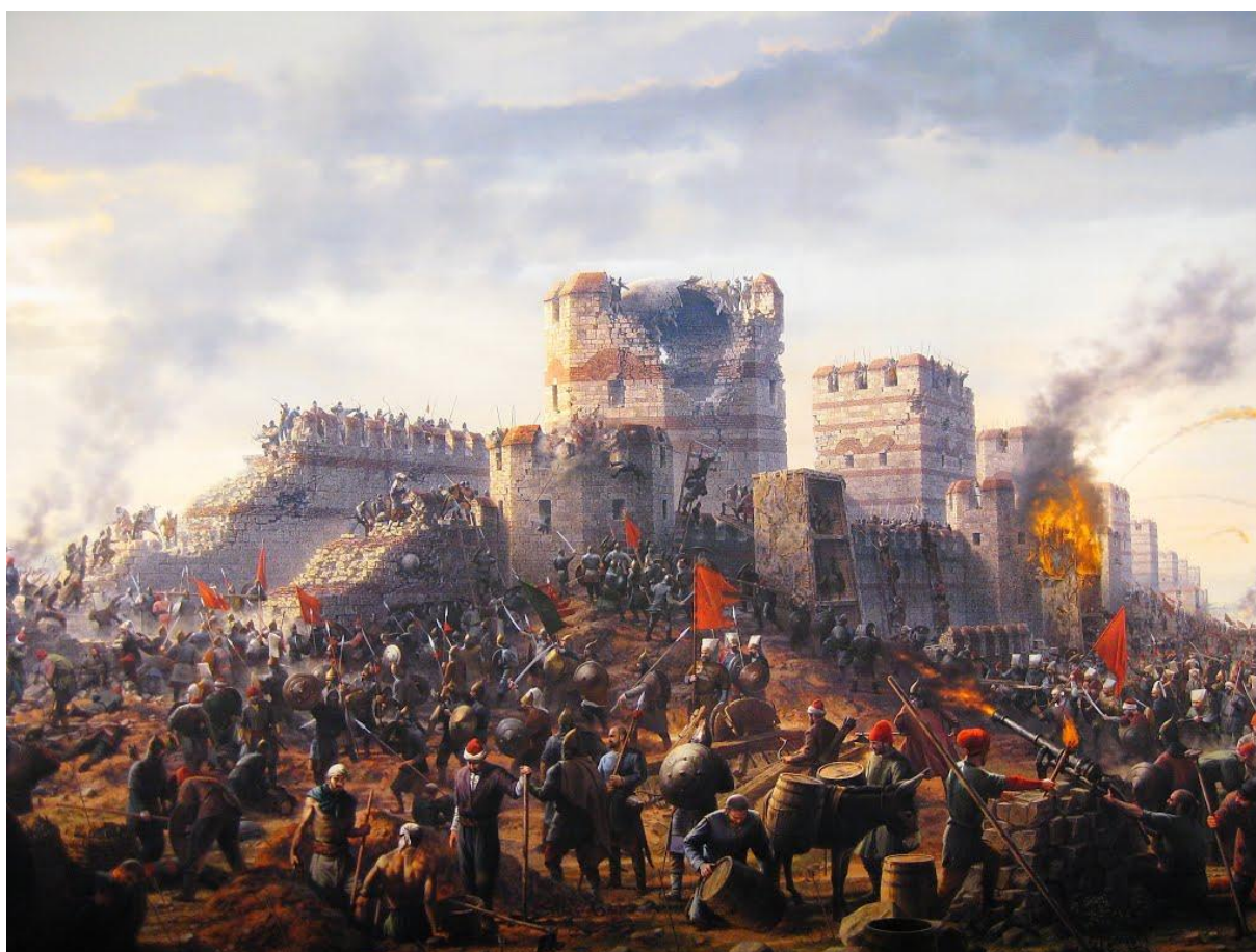
Unutrašnjost Panorame 1453