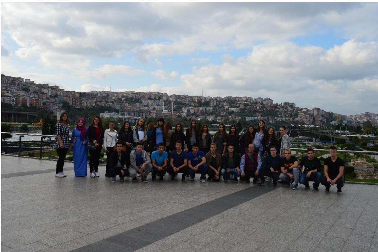
Zajednička fotografija na Miniaturku. Cijeli svijet nam na dlanu...