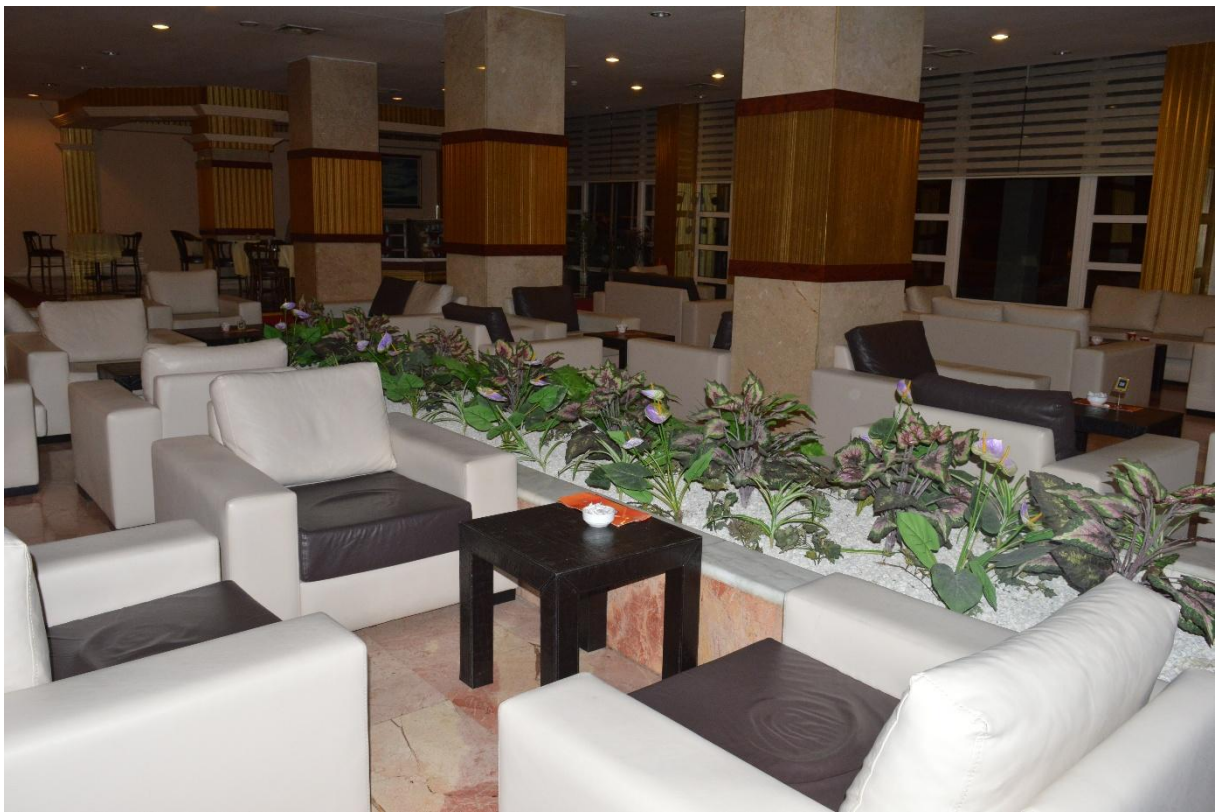
Lobby studentskog hotela