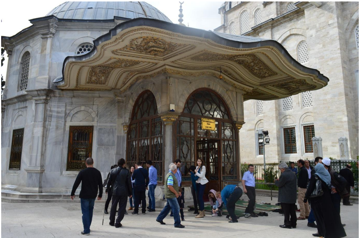
Naše kolegice i kolege ipred ulaza u turbe sultana Mehmeda Fatiha