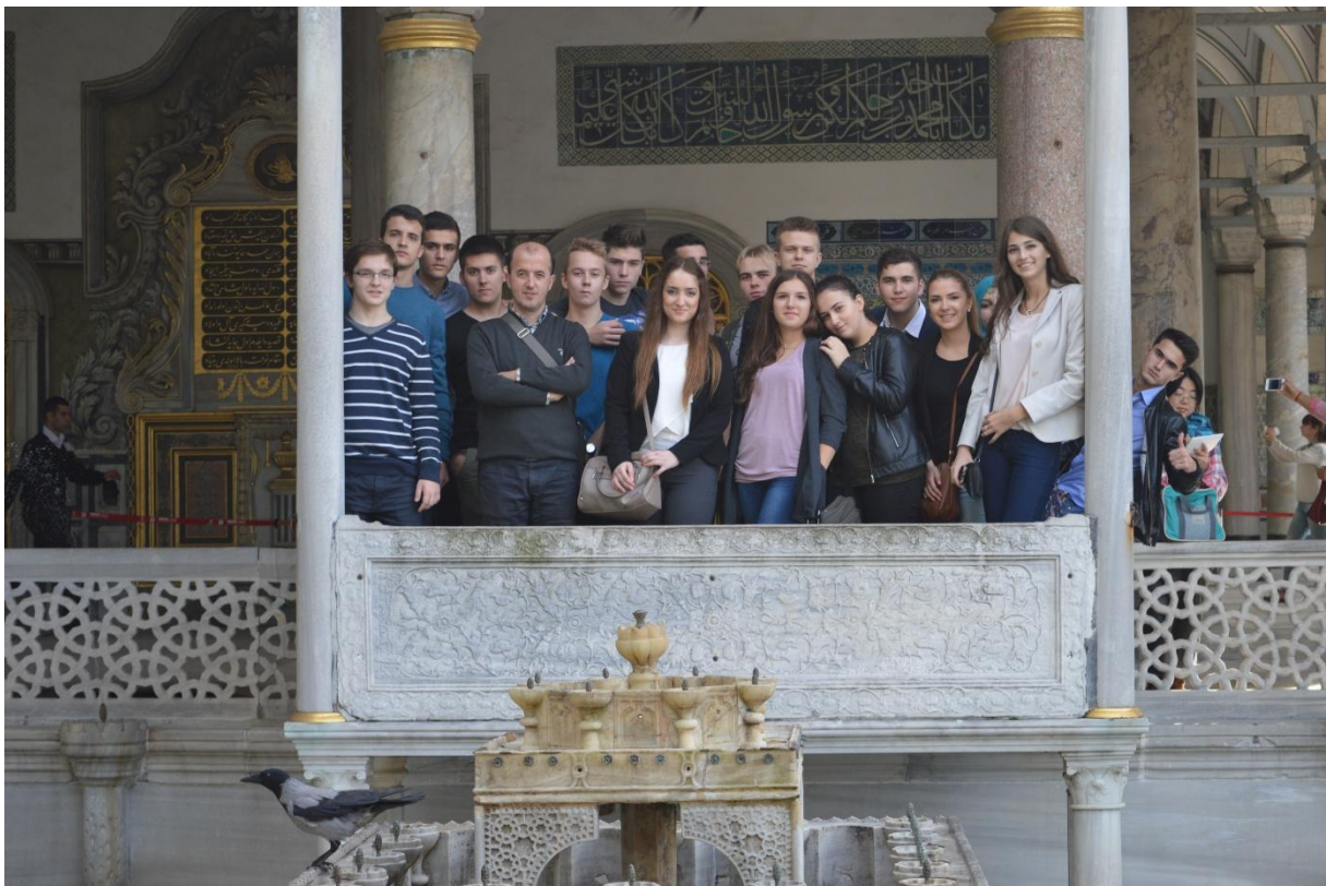
Na balkon palaće

Nakon napornog, ali zanimljivog dana, uputili smo se na zasluženu večeru u blizini Panorama 1453., gdje nas je dočekala predstavnica Udruženja mladih u Istanbulu te tom prigodom, tijekom večere, prezentirala nam je aktivnosti Gençlik Meclisi. Nakon prezentacije naš ravnatelj je upoznao domaćine s aktivnostima naše škole i Islamske zajednice u Hrvatskoj.