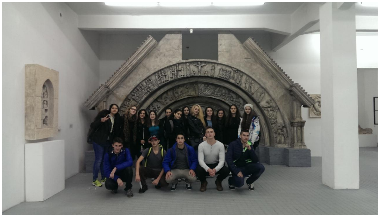
Slika 6 Radovanov portal

Ono što nas je također zanimalo u gliptoteci bili su stećci odnosno nadgrobnji spomenici, “kameni spavači”. Izloženo ih je zaista mnogo. Različitih su oblika, veličina, način na koji su obrađeni motivi koji su se nalazili na njima te se po tomu da zaključiti da su se po mnogočemu razlikovali jer je to odraz tadašnje kulture u kojoj je bila bitna staleška podjela. Zanimljivo je da je većina tih spomenika nađena na jednom prostoru, odnosno grupirana je što je vjerojatno označavalo obitelj ili neku povezanost između umrlih.