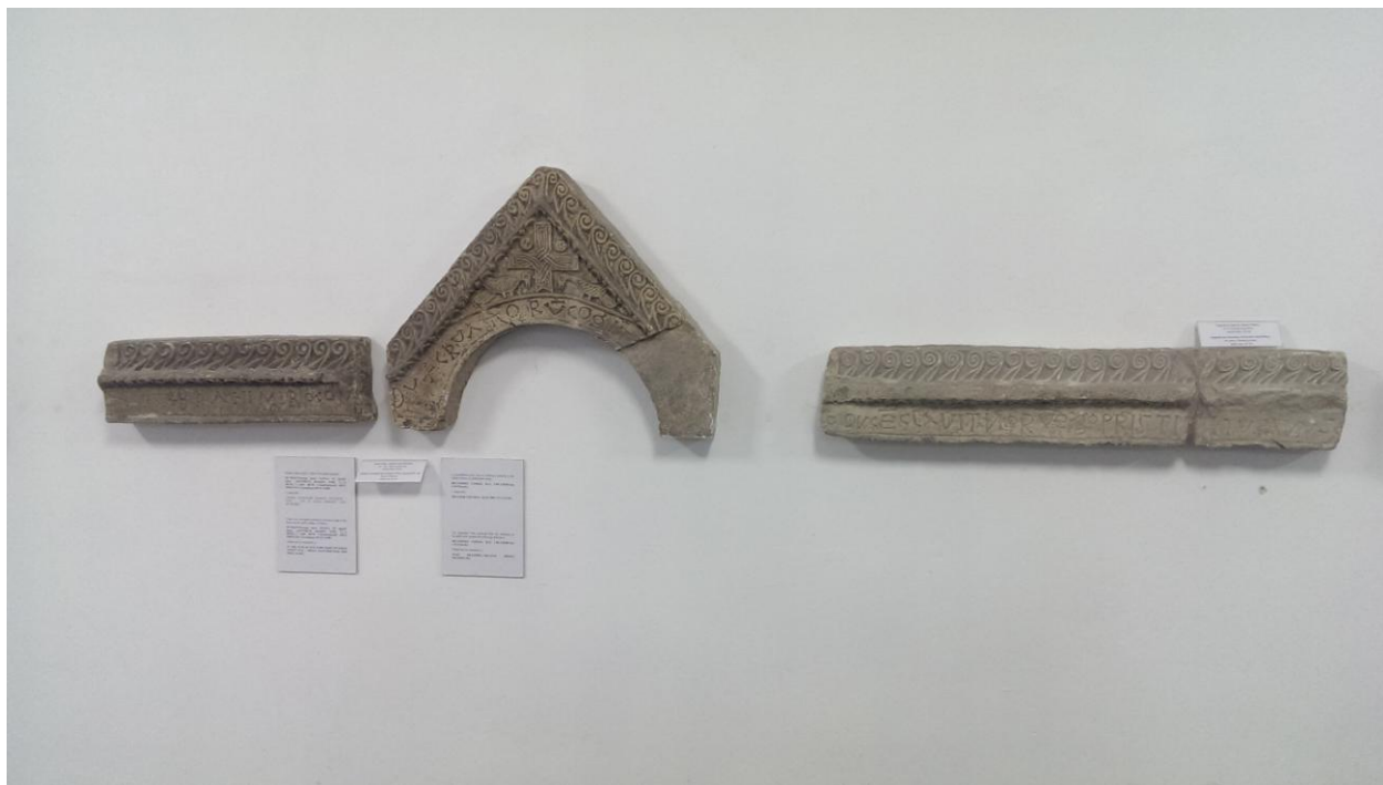
Slika 3 Dva od ukupno pet kamenih natpisa kneza Branimira