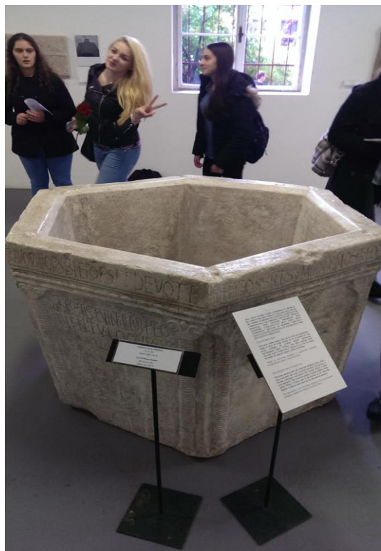
Slika 1 Višeslavova krstionica

je sačuvano i crkvenog namještaja (fragmenata) i dijelova unutrašnjosti crkvi. Ono što je prevladavalo u srednjem vijeku bila je vjera, odnosno kršćanstvo stoga je i to i glavni motiv u umjetnosti. Teme koje su prevladavale također su bile usmjerene na religioznost. Iz tog vremena sačuvane su crkvice koja svaka u sebi nosi neku priču. Veže se uz vladavinu određenog vladara, moćnog čovjeka zbog kojeg je nastala. No u ranom srednjem vijeku malo znamo o imenima umjetnika koji su sve to izradili. Kako se umjetnost širila i napredovala tako je ona bila sve bogatija i bogatija. Sve je manje bilo praznog prostora što se može vidjeti na fotografijama.