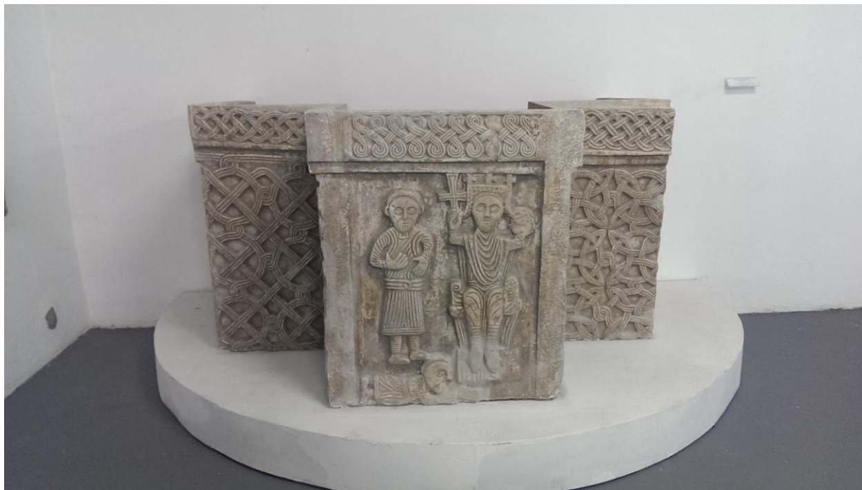
Slika 2 Krstionica iz 11.st., možda Petra Krešimira IV