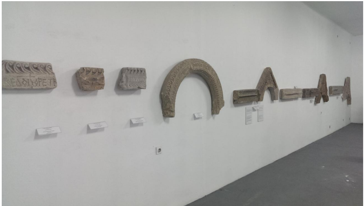
Slika 4 Ostali kameni ulomci