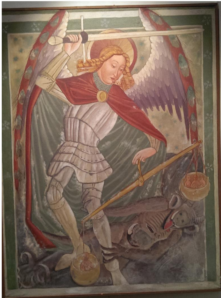
Slika 8 Ereska anđela prikazanog kao srednjovjekovni vitez