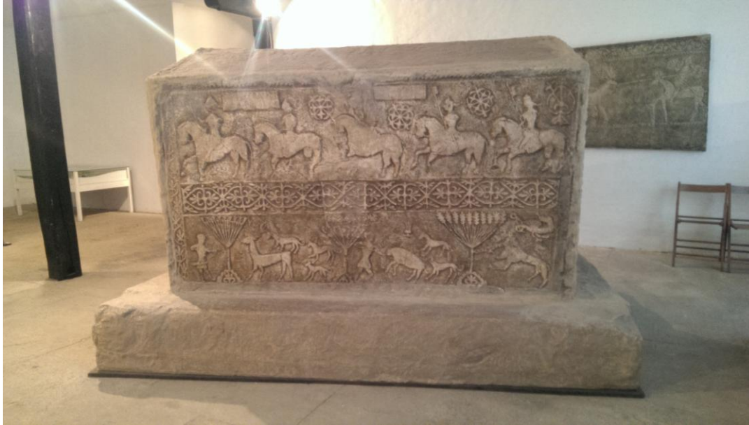
Slika 7 Stećak Kulina Bana

Pogledali smo i nekoliko kopija freski iz crkvice sv. Marije na Škrilinama (u Istri) koje je naslikao poznati majstor Vincet iz Kastva 1474. Majstor Vincent biblijske motive smješta u tipičan istarski pejzaž s brežuljcima i gradićima (Molitva na Maslinskoj gori), a scenu Poklonstva kraljeva interpretira izrazito svjetovno, slikajući dominantnu dvorsku povorku dama i vitezova u kasnogotičkoj odjeći. Ove kasnogotičke zidne slike karakteristične su za istarsku lokalnu školu druge polovice XV. st., a majstor Vincent iz Kastva njezin je najbolji predstavnik.