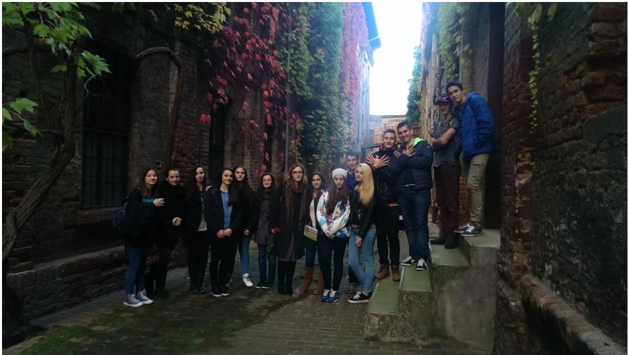
Slika 9 Jesen na zidovima stare kožare

Grupnom fotografijom s divnom jesenskom pozadinom od rujnog lišća završio je naš posjet gliptoteci.