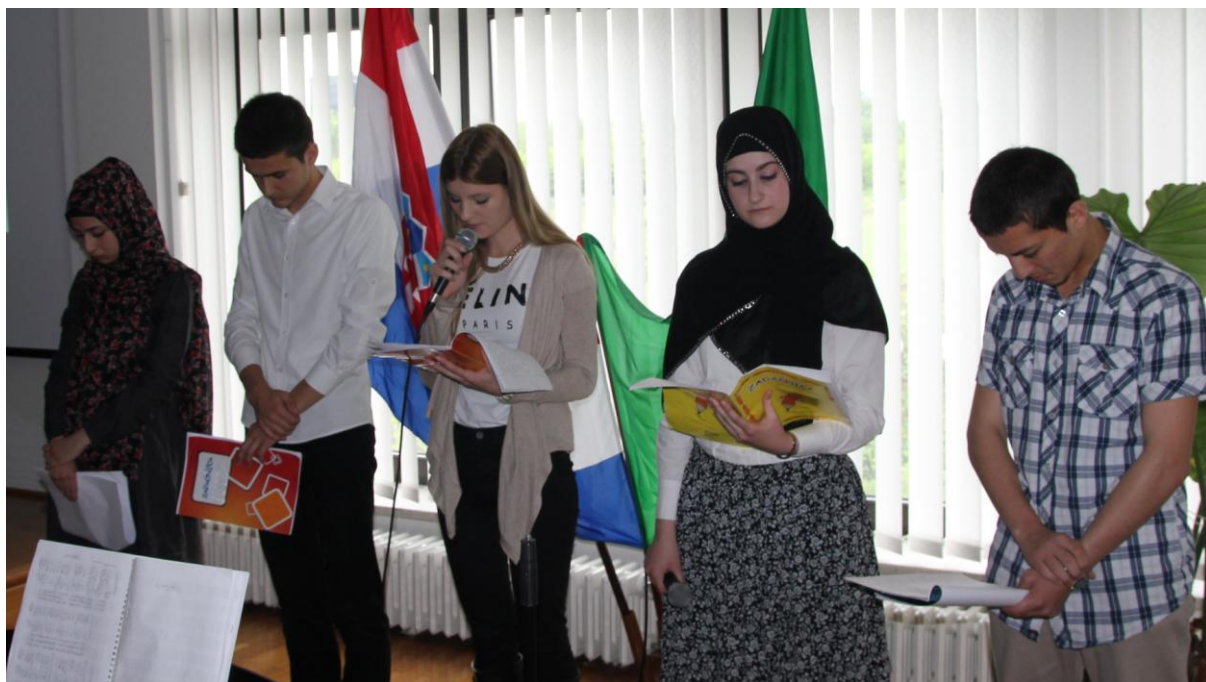
Učenici čitaju pisma svojih kolega i kolegica